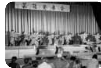
わしま よさこい颯