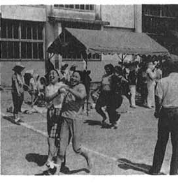
【写真】1着でゴールイン、お疲れさん

ママさん 大ハッスル 八月六日、婦人学級生活教室運動会が、北原中学校で行われました。この日は、若いママさんから、ママさんまで百六十名余の参加とあって、種目も多種多様に物価高へのあてこすりか、パン食いならぬ、菓子食い競争には「さすがママさん」との声もチラホラ、ちなみに、この日はほとんど全員の方が賞品を手に入れた。友誼ムード満点の大会でした。