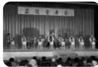
和島太鼓教室みゆき会