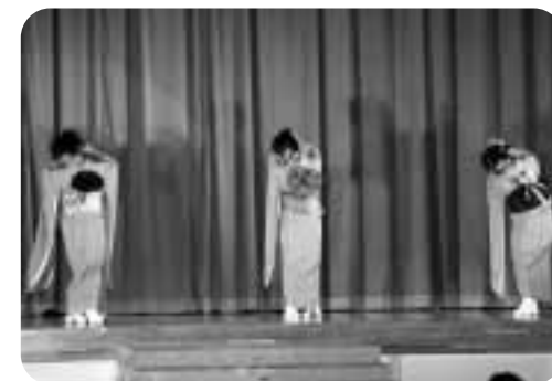
たか子着物教室 帯に咲いた一輪の花