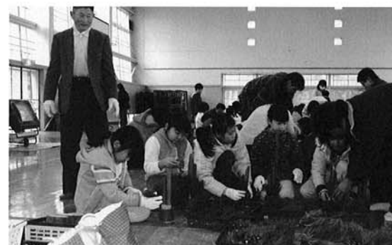
▲一生懸命門松づくり

ミニ門松とはいえ、竹を斜めに切る作業は大人も苦戦するほどでしたが、参加者同士の協力により、すばらしい門松が完成しました。この門松を飾って、新年を迎えましょう。