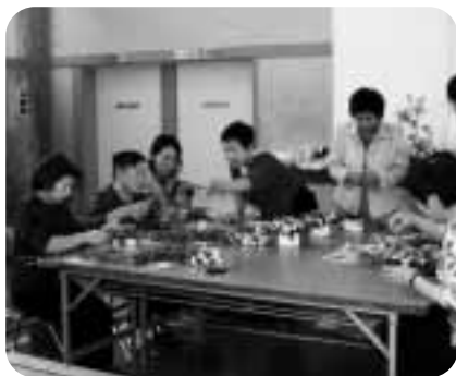
アレンジフラワー