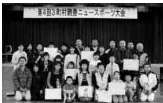
和島のチームの入賞者の皆さん