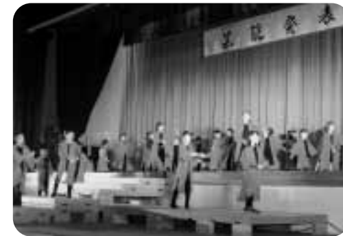
わしま よさこい颯キッズ 元気に舞いました