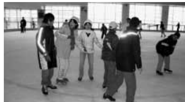
コツをつかんでスイスイとすべる

11月19日(土)に柏崎アクアパークを会場とし、アイススケート教室を実施しました。柏崎までは、電車を使っての移動です。柏崎到着後、交通ルールを守りながら歩いて柏崎アクアパークに向かいました。到着後早速初心者も経験者も指導者から講習を受け、その後自由滑走をしました。最初はすつんころりんと転ぶ子供達の姿が見られましたが、あっという間にコツを覚えスイスイ滑っていました。子供達の運動神経には驚かされるばかりです。帰りの越後線の電車のなかでは、疲れて眠る子供もいれば、まだまだ元気いっぱい子供もいました。