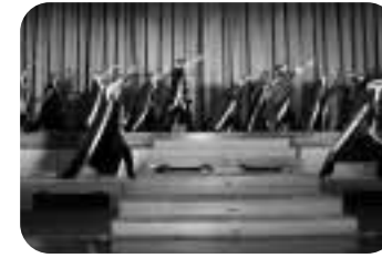
良寛わしまYOSAKOIソーラン隊