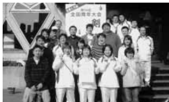
大会参加者と応援団の剣道クラブの皆さん