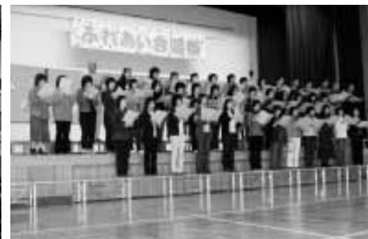
1学年PTA WAになって踊ろう

紙」を生徒全員で歌い締めくくりました。生徒にとっては日ごろの練習の成果を十分に発揮できた音楽発表になったのではないのでしょうか。