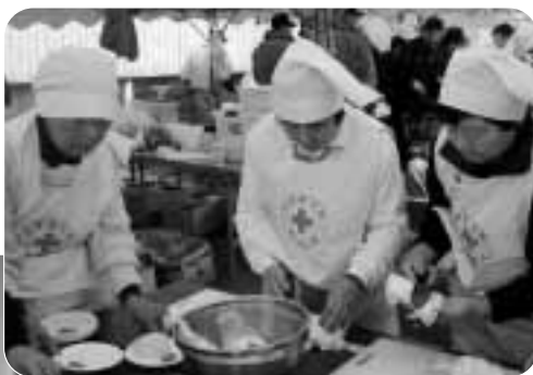
日赤奉仕団炊き出し訓練