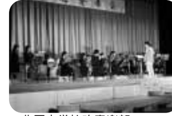
北辰中学校吹奏楽部