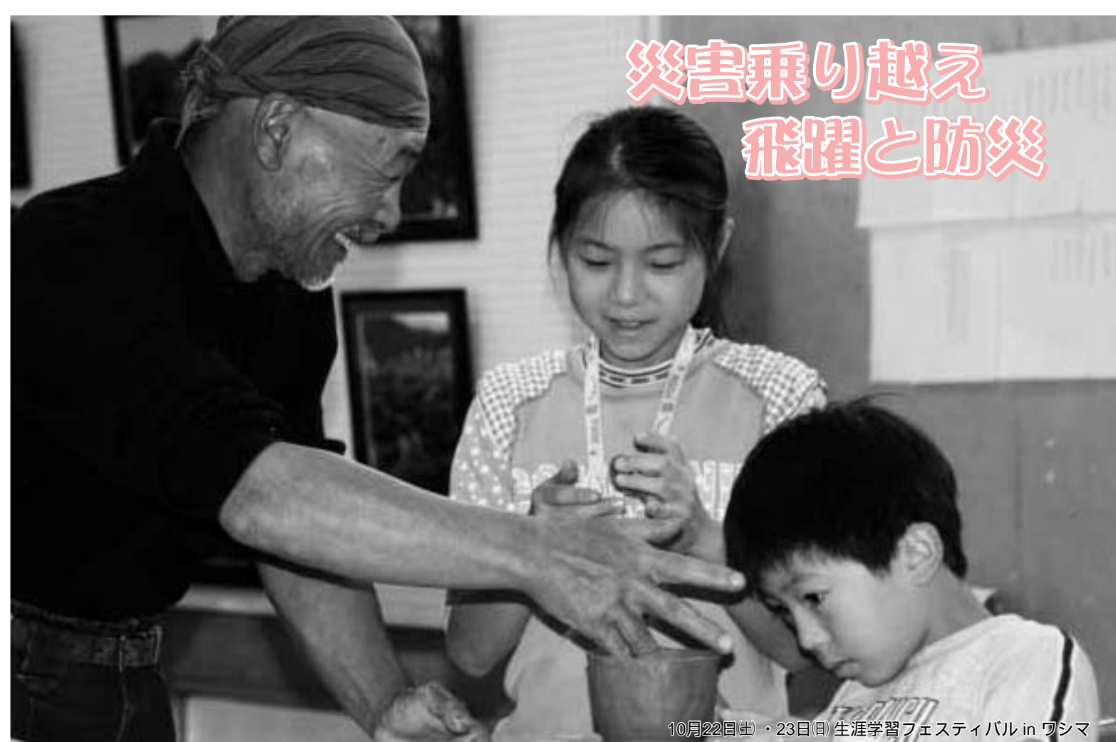
10月22日(土)・23日(日)生涯学習フェスティバル in ワシマ