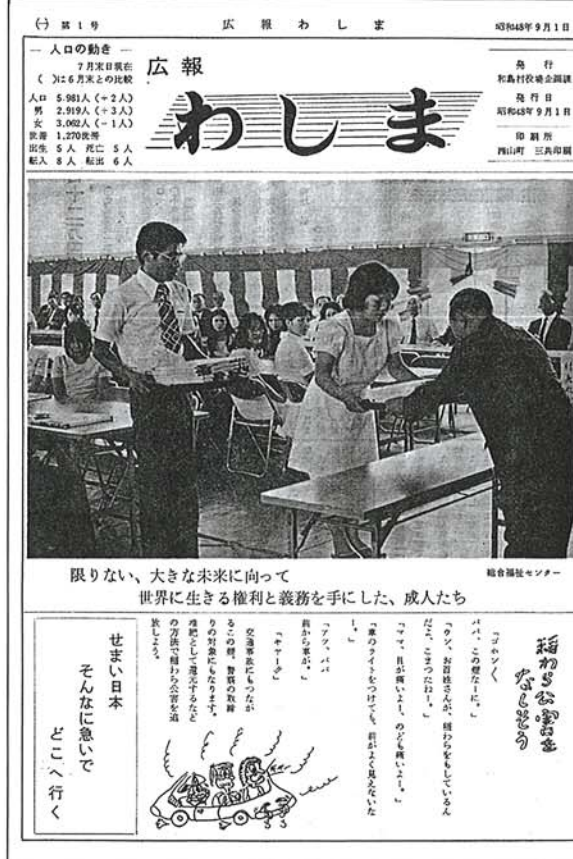
限らない、大きな未来に向って 世界に生きる権利と義務を手にした、成人たち

「わし」の歴史を振り返る。昭和48年9月1日発行の第1号の表紙は、成人式の様子を捉えた写真だ。当時の和島村は、戦後復興の真っ最中だった。この号は、村の未来を担う若者たちへのメッセージとして発行された。当時の村長は、この号の発行を「わし」の始まりと捉えていた。この号からは、村民の生活や行事、村の歴史を細かく掲載するようになった。この号は、和島村の歴史を伝える貴重な資料として残されている。