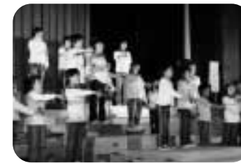
手話・歌声楽団「紅葉」