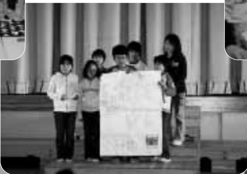
少年教室防災報告書発表会