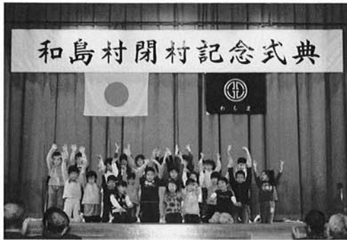
▲幼稚園児によるアトラクション

最後に「わしま」の文字をイメージした村旗が後納され厳かに和島村の歴史に幕が降ろされました。和島村は平成18年1月1日より長岡市の一員として、また新たな歴史を歩みはじめます。