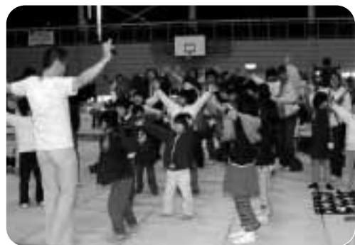
さわむらのおっちゃんによる講演会とニコニココンサート