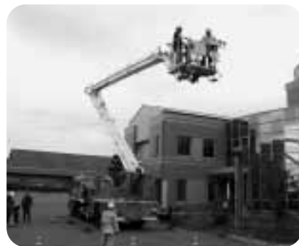
消防はしご車体験コーナー