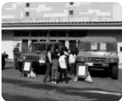
自衛隊 災害車両展示