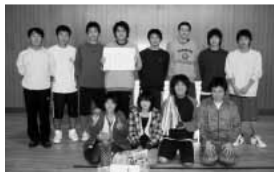
優勝したTeam池田と応援団の皆さん

中学生や青年チームが多く、若いパワーが溢れるエネルギッシュな大会となり、プロ顔負けの好プレー・スーパープレーも随所に飛び出す大会となりました。なお、結果は次のとおりです。 優勝 Team池田 チーム 準優勝 キムズ チーム 3位 肉まんパート2 チーム