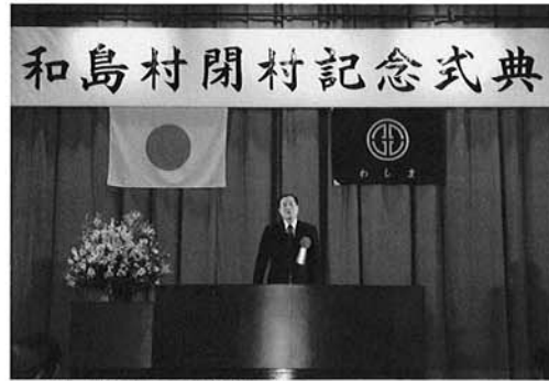
▲森長岡市長のあいさつ