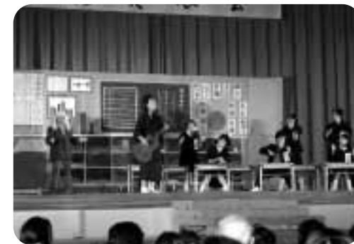
和の会 今年も笑わせてくれました 手話の劇