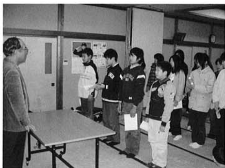
▲修了証を受けとりました。

その後、少年教室修了証書授与式が行われました。いろいろな体験やグループ活動があった少年教室でしたが、みなさんにとって良き思い出となったでしょうか。