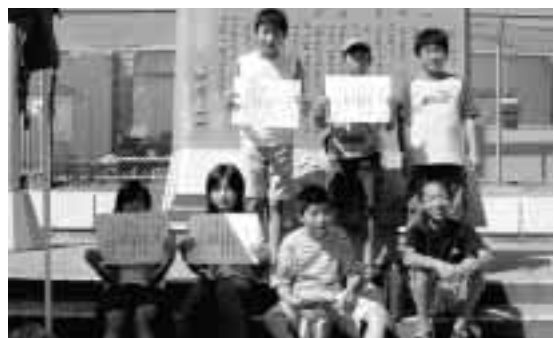
大会後、みんなで集合写真

去る8月24日(水)、新潟県内B&G海洋センターが連帯と親睦を図るとともに技術力の向上を目的として、水泳大会が和島村B&G海洋センターにて行われました。中条町から上越市頸城まで8地区、約80名が参加し、9種目のレースを行いました。プールの中には応援の声が響きわたり、熱戦が繰り広げられました。和島村からは、7名の参加者があり、優勝を勝ちとるなど、競技力の高さを示していました。