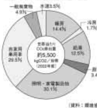
家庭からの二酸化炭素排出量の割合

二酸化炭素は産業などだけでなく、私たちの家庭などさまざまなところから排出されています。排出量では、照明・家電製品などが30.1%でトップです。また、自家用乗用車は29.5%で、暖房は14.4%、給湯が12.5%となっています。