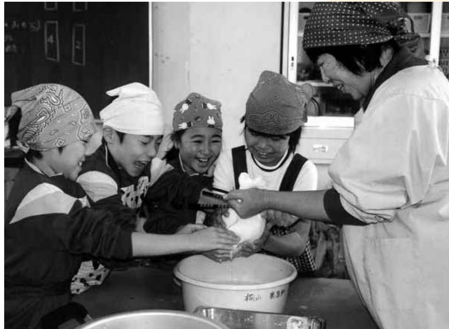
12月10日 桐島小学校3年生豆腐作り