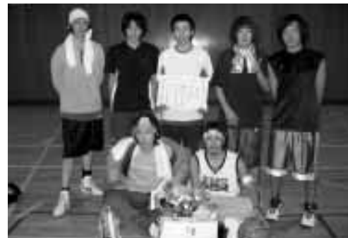
優勝した肉まんチーム

11月21日(日)、和島村体育協会主催による「村民バスケットボール大会」が北辰中学校体育館で開催されました。今年は、13チーム、約100名が参加エントリー！中学生や青年チームが多く、若いパワーが溢れるエネルギーあふれる大会となり、プロ顔負けの好プレー・スーパープレーも随所に飛び出しました。 決勝戦は、追いつ追われつの接戦となり、会場も大いに盛り上がりました。結果は、「肉まんチーム」が、見事伝統の大会を制しました。 なお、結果は下のとおりです。