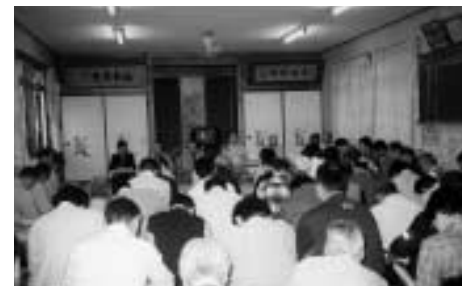
東保内集落開発センターでの説明会

説明会には多くのみなさんからご参加いただき、貴重なご意見を賜ることができました。本当にありがとうございました。