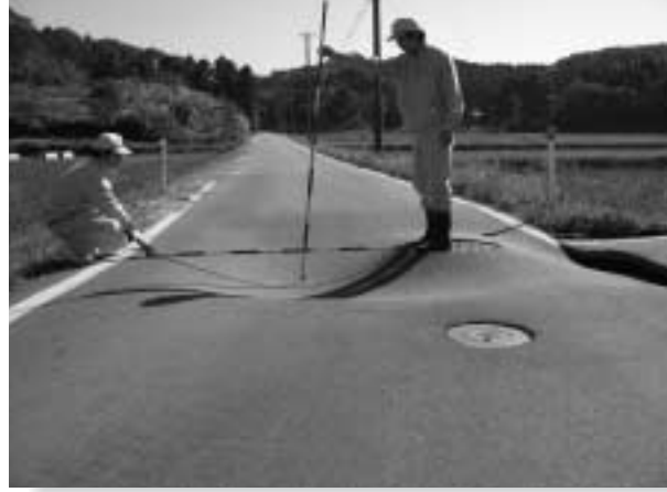
▶村道の被害を確認