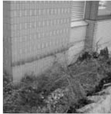
役場 壁にある黒い線が本来の土面