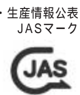
生産情報公表 JASマーク

Q 化学肥料や農薬の使用を減らして生産された農産物は、食の安全の観点からも、野菜を販売する際に、禁止されている表示はどんなものがありますか