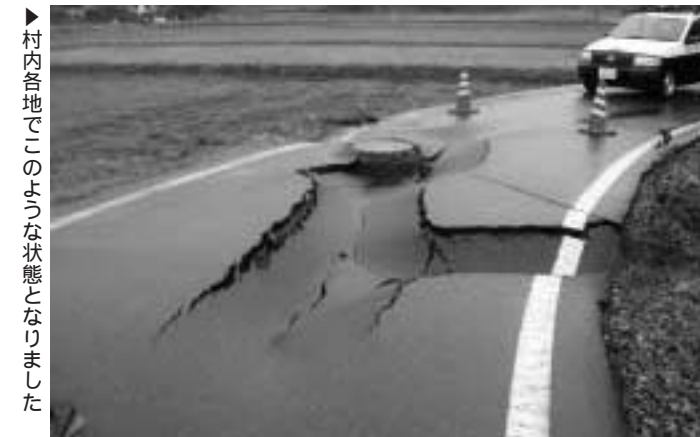
▶村内各地でこのような状態となりました

自主避難 地震発生当日は77名が和島村保健センターで不安な一夜を過ごしました。その後地震活動が沈静化するにつれ避難される方も減っていきましたが、10月27日に大規模な余震が発生したため、この日は39名の方が自主避難されました。