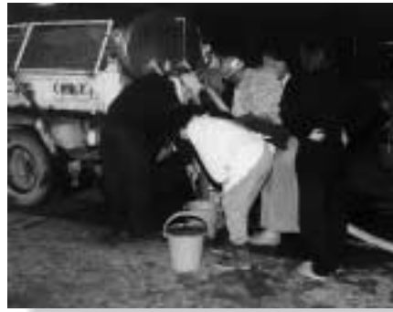
大勢の村民が水を求めて集る

地震の影響により断水が発生。10月24日朝には村田地区を除く全域で断水しました。給水車は同日昼すぎまでに県内各地から集まり、給水活動を開始しました。それとは別に村内の湧き水スポットには人が大勢の集まり、鹿島神社（上小島谷）では多くの人がポリタンクを持ち湧き出る水を汲んでいました。