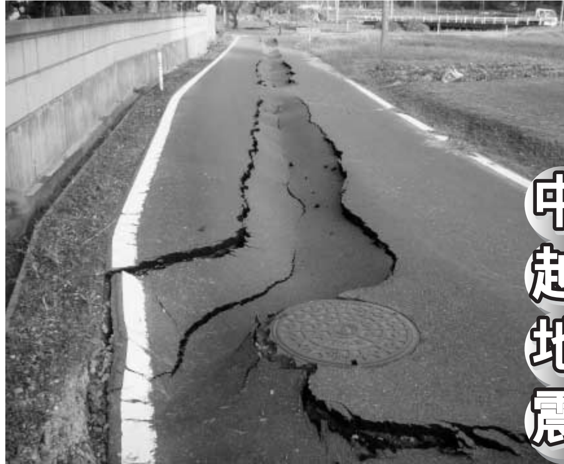
中小島谷の陥没した道路