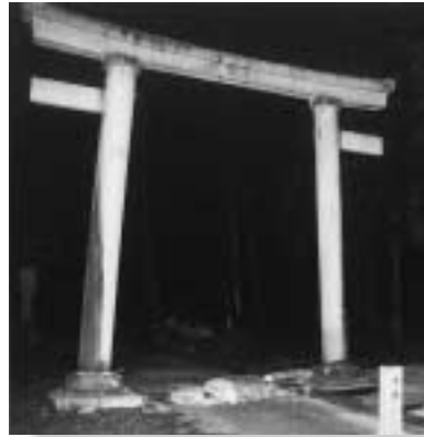
鹿島神社 鳥居一部損壊