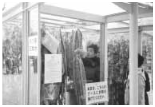
気持ちのこもった折鶴を掲げる