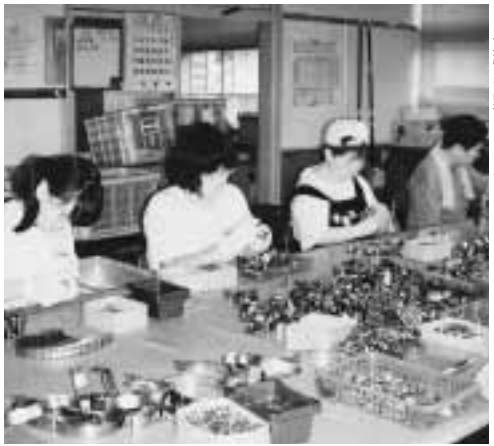
◀勉強も黙々としている？

工房ゆきわりでの作業活動の様子。ゆきわり会の皆さんが日頃行なっている配管金具の組み立てのお手伝いをしました。この日を含め2日活動を行いました。