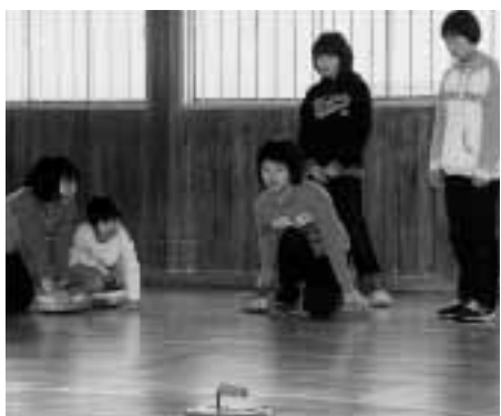
ペンキでお絵描き

6月1日、オープン前のB&Gプールにてプール清掃が行われました。ビニールテントに覆われた室内はサウナのような蒸し風呂状態。そんな過酷な状況下の作業となりましたが、一生懸命にプールの清掃をしてくれました。