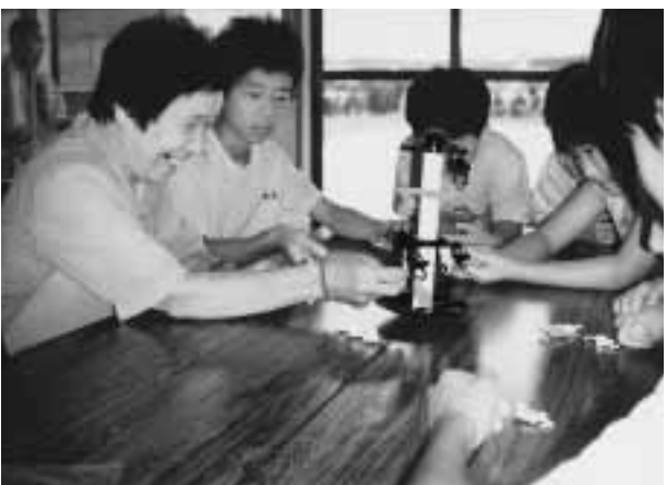
◀なかなか上手にいかないわ

夏季昼食会。この日はお年寄り、ボランティア・中学生三者が毎年交流を図る日です。児童クラブの子供達も加わりゲーム・水塗り絵・茶席コーナーをそれぞれ楽しんだ後は、ボランティアさんが腕をふるった料理を皆でいただきました。男の子達の食べっぷりのよさにお年寄りも、ボランティアさんも舌を巻くほどでした。