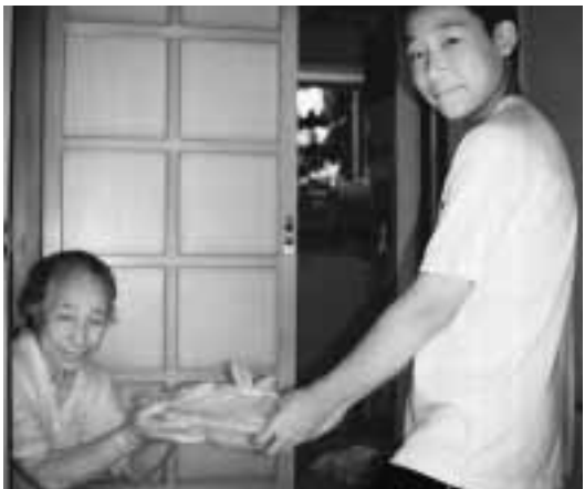
◀カメラ目線にちょっとテレビ気味

毎週水曜日実施の配食サービス。折り紙で作った花と、メッセージカードを添えて配達です。思いがけない中学生からのお届けに心なしか利用者の皆さんの顔もいつも以上に笑顔？