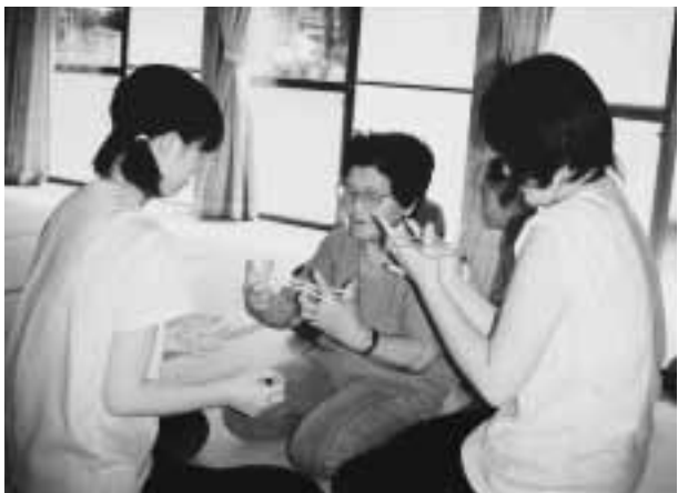
◀昔懐かしいあやとりあそび

地域リハビリ・サロン活動は年々各地域での展開が増加、期待が高まる活動です。現在実施されているリハビリ・サロンに地元の中学生が参加しました。自己紹介は「屋号」も言うとお年寄り、ボランティアの皆さんは判って良いみたいです。あちらこちらで「こんなに大きくなって…」の声が聞こえてきます。意外なところで地域の子供達の成長を知ることができたようです。