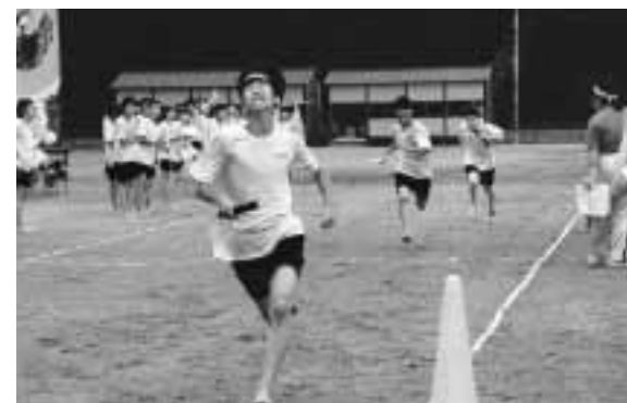
▲軍対抗選抜リレー

前日からの雨があがった、9月14日(土)、北辰中学校でふれあい体育祭が開催され、青軍と紅軍の2軍にわかれた生徒たちは、総合優勝を目指して競技に応援に白熱した熱戦を繰り広げました。 今年は、午前、午後あわせて13種目が行われ、中でも最後の競技軍対抗リレーでは、抜きつ抜かれつの展開になり、最後の力を出しきった競争は見ごたえ十分でした。 応援に駆けつけた家族からも、生徒に負けじと熱い声援を送っていました。今年の結果は青軍の優勝でした。