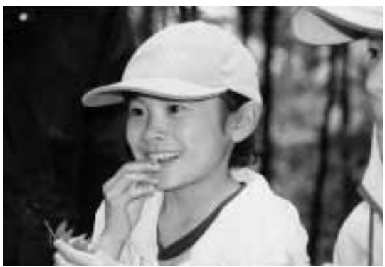
シイタケの駒打ち

特に6月号の表紙にあるように山椒などの葉を口にするなど、子ども達にとっては普段することのできない体験となりました。