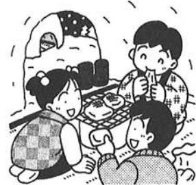
和島村社会福祉協議会

社会福祉に役立ててほしいと和島村社会福祉協議会に次の方々よりご寄付をいただきました。厚くお礼申し上げます。