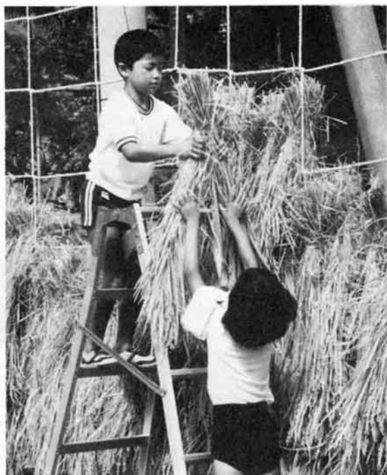
高い所は、男の子が掛けます