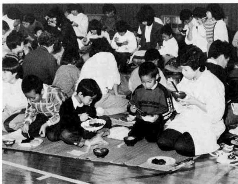
お家の人と一緒に食べる、おもちの味は格別です

け。あとは家に持ち帰って完成させます。「家に帰って孫とワラジ作りが共通の話題になり楽しかった」とは、指導に当たった老人クラブのメンバーの話。 十月二十五日(日) 今日文化祭。苦勞した縄やワラジも展示し、お父さんお母さんから見てもらいました。お昼は待ちに待った収穫感謝祭で、学校田でとれたお米八十五・六ぎぎで、大好きなあんこもち・きなこもち・雑煮を作り、先生・家族と一緒に食べました。 西谷小学校の子どもたちは、半年間農作業を通して作る喜びを体験し、お年寄りの知恵を知り、豊かな心を育てることができたと思います。 これは、「ゆとりの時間」の活用であったと思います。