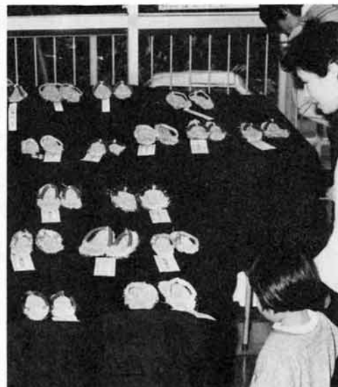
自分の足に合わせ(?)一生懸命に作った ゾウリです