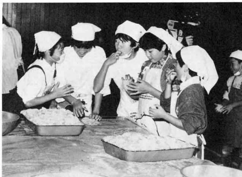
早く食べたいね、このきなこもち