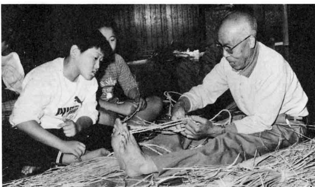
ワラゾウリ作り、あまりに鮮やかな手さばきに、つい見とれてしまいました