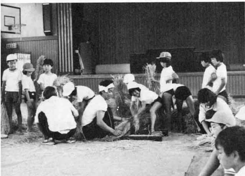
千歯を使って脱穀作業。思ったより力があるのね