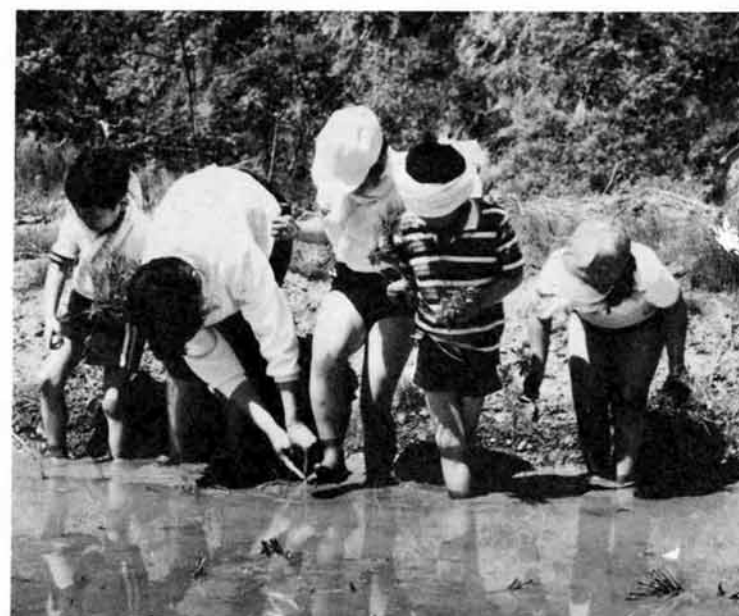
「あ！カエル」「苗踏んじゃだめよ」「ゴメン」「ん」「どうしたの」