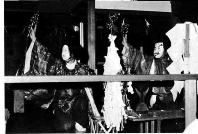
男神と女神の結婚の舞（多摩神と称する舞）