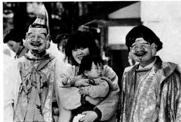
あまりの笑顔に坊やもびっくり