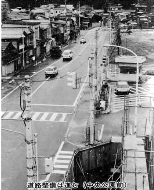
道路整備は進む(中央公園前)

市街地及び周辺地域 市街地の商店街は、核となる店舗が少なく、商業地域としての高度利用がなされておらず、また、住居地域及び準工業地域においては、工場と住宅の混在化がめだっています。今後は、新規企業をはじめ市街地に混在する中、小工場等の集積配置等計画的な土地利用を図ることが課題です。