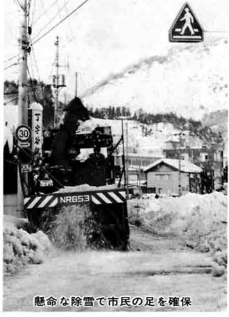
懸命な除雪で市民の足を確保

流雪溝の整備促進を図ります。また、水源(湧水)の豊富な地域については、路面流水道路等水利用による融雪施設の整備を図ります。