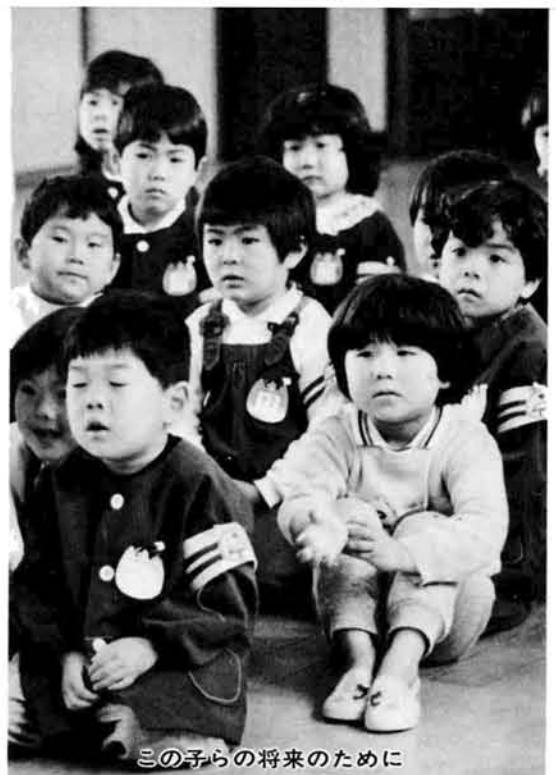
三の子らの将来のために

この基本計画は、本年度を初年度とし、昭和六十五年までの五か年間に何をなすべきかの手段を具体化し、実施しなければならぬ事業を明確にして、「住みだくなるまち、往きだくなるまち」の実現をめざすものです。