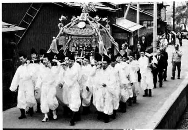
1トンもあるみこしをかついで村内をねりあるく白丁