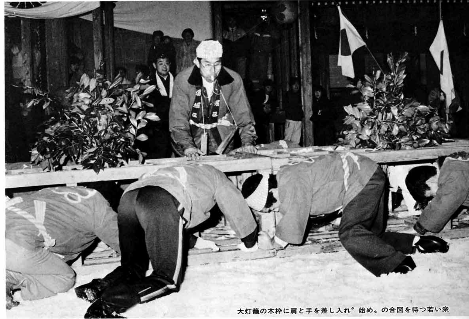
大灯笼の木枠に肩と手を差し入れ、始め、の合図を待つ若い衆