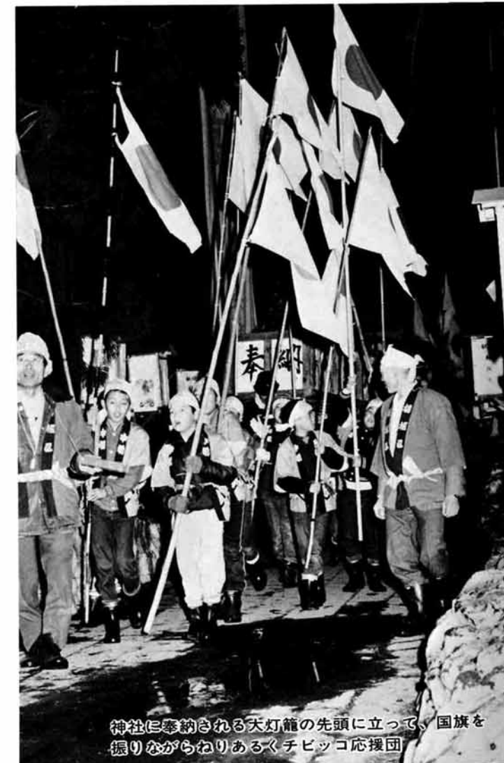
神社に奉納される大灯笼の先頭に立って、国旗を振りながらねりあるくチビッコ応援団