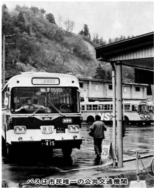
バスは市民唯一の公共交通機関