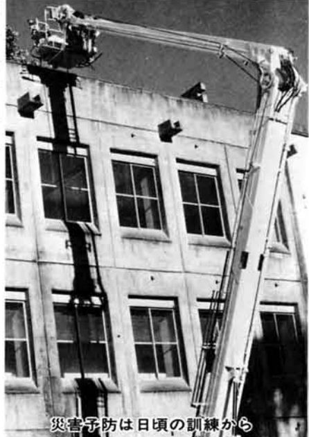
災害予防は日頃の訓練から