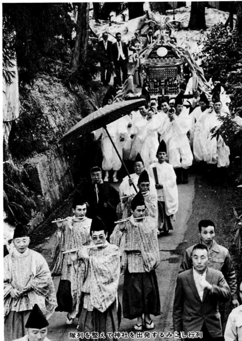
隊列を整えて神社を出発するみこし行列