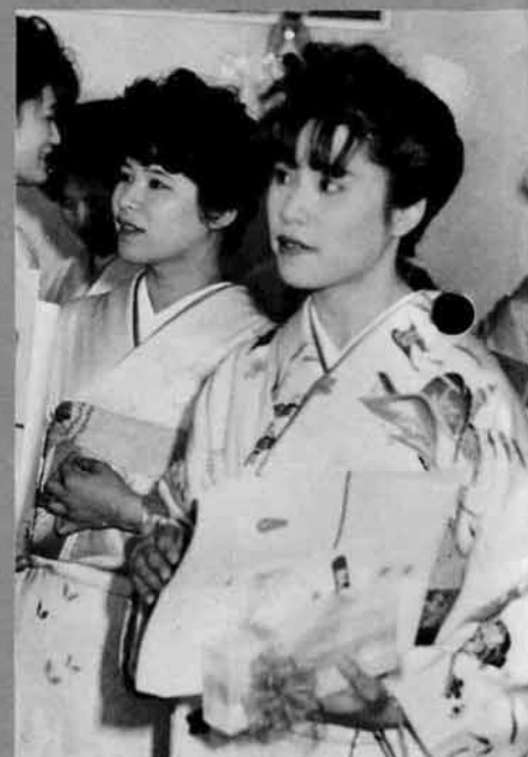
ことしの成人 男 223人 女 220人