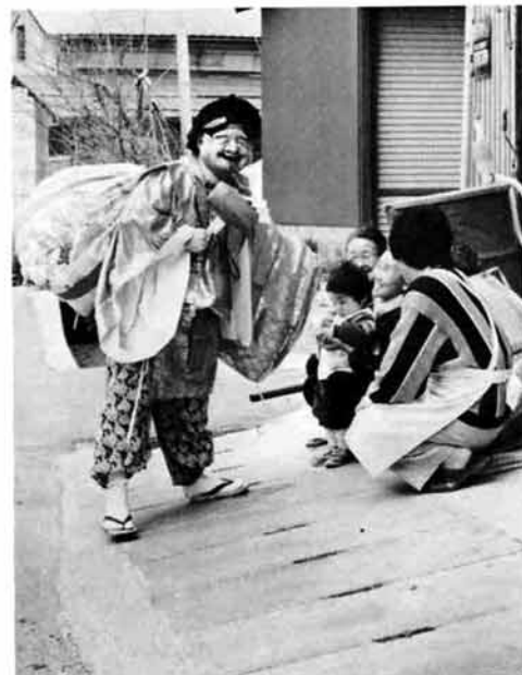
家々ごとに福をさずけて回る大黒さま

十五日には、巢守神社での神事のあと、みこし行列が繰り出され、区内を回りながら、見物の人や道行く人に恵比須・大黒が、お菓子やあめを配りながら、無病息災、家内安全を祈っていた。