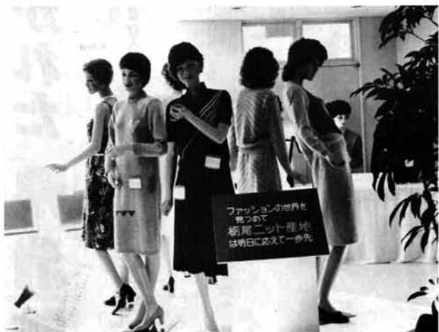
ニッソト製品展示会