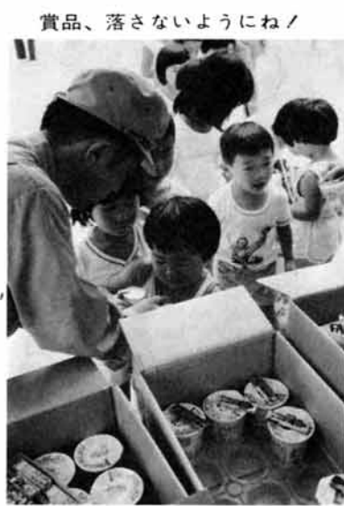
賞品、落さないようにね!