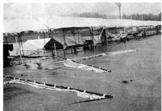
激しい雨で荒れたポンプ操法競技会場

管を設置して降雪時の火災に備えるための事業費と手引ポンプを積載車などに換え機動力配備。その置場と用地確保を国庫補助事業として採り上げてもらうよう関係官庁へ要望することを決議しました。 また、表彰式では、消防団以外の繁窪子供会が昭和十五年から一日も休まず、「火の用心」の夜巡りをしている功績が認められた表彰と、人命救助をした黒埼町の二人の女性も表彰されました。 このほか、消防に功績のあった消防団、団員の表彰に長岡市濁沢地内の地すべり、守門村大倉なだれ、湯之谷村下折立なだれなどの災害で尽力した消防団が県知事などから表彰されました。