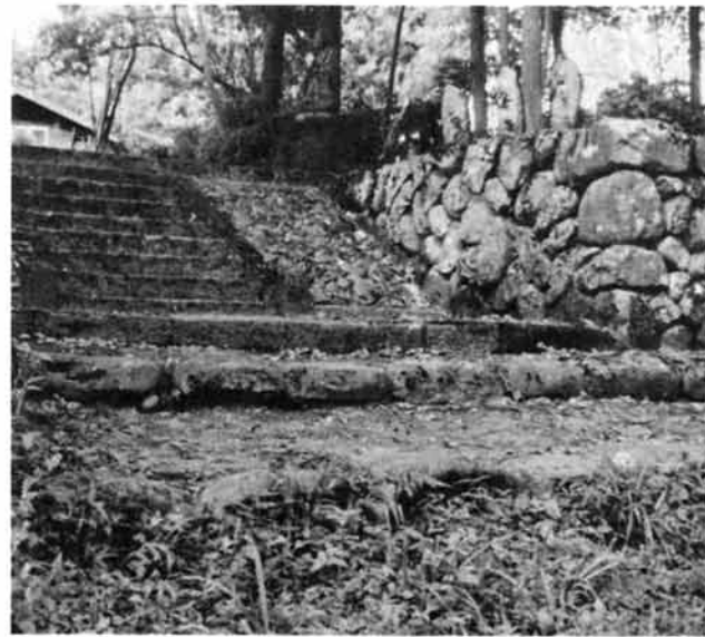
蘭溪道隆が開山した高德寺山門(栃堀)