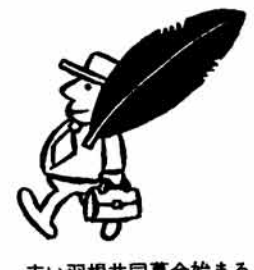
赤い羽根共同募金始まる

～献血は健康のバロメーター あなたの愛を献血に!～ 予防接種は9月10日号をご覧ください