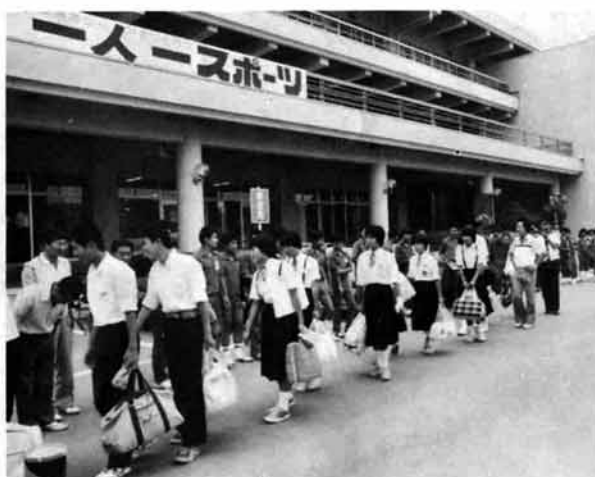
白鷹公民館で出迎えを受ける

姉妹都市の白鷹町(山形県西置賜郡)とは、議会議長関係者やスポーツ団体などの間で毎年、交流を深めています。この日は中学生の交歓会を計画。さる八月六日、市内全七校の代表二十三人がマイクロボスで市役所を出発しました。五時間かかって午後一時白鷹町の中学生や町民の出迎える公民館に到着。盛大な歓迎を受けました。 白鷹町助役の歓迎のあいさつ、栃尾市長のメッセージをおくった後、いよいよ生徒同士の間で交歓会。「生徒会運営の問題点は何ですか」「特色のある生徒会行事を紹介してください」