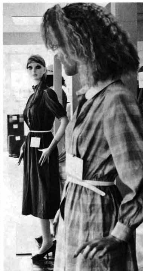
軽さと風合を生かしたニット製品

昨年まで「繊維まつり」として行ってきたまつりを、市民総ぐるみで参加するまつりにと、今年から「栃尾まつり」と改称して、にぎやかなまつりに盛り上げました。 主催も商工会から観光協会にバトンタッチ。まつりの初日は「繊維のとちお」をメインにうちだし、市民会館では、来年初尾で生産する春、夏物の織物展示会を行って、市民に栃尾で作る織物とニッソトの華麗(かれい)さと技術の最高峰を披露しました。この展示会には、市内の大手から中・小の企業四十九社が出品し、栃尾産地の意欲を示していました。 また、二日間の展示会と併せ産地織物生地と製品の即売会も行い、捨て値同然の品物がとぶように売られていました。このほか、栃尾製品のファッションショーも行われ、栃尾織物がおりなす幻想をかももし出していました。 初日の二十六日の夜は、栃尾甚句流し、市民のだれもが気軽に踊れるとあって、大にぎわい。踊り子が列からあふれるくらいなら、見物人も押すを押すの大混雑。 翌二十七日は、各町内や事業所が趣向をこらして造った仁和賀(にわか)と樽みこしの大共演、決められたコースを巡回してまつりを盛り上げました。 正午すぎには、朝からときおり降っていた雨足が激しくなってきましたが、まつりは最高潮。巡回の終わった樽みこしは、綱引き会場の秋葉公園へ、どろんこの中、市長杯をめざして力闘しました。