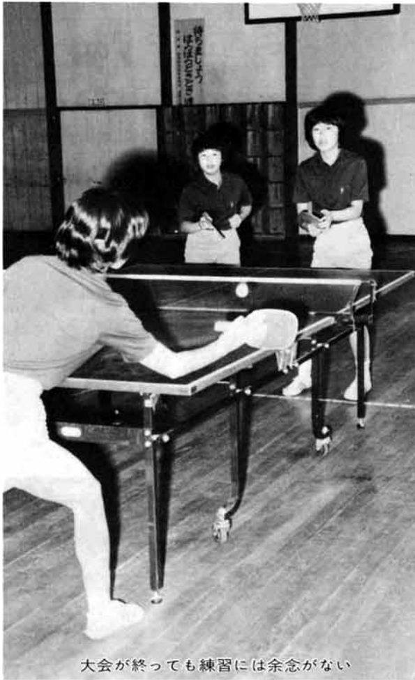
大会が終わっても練習には余念がない

北信越大会など、四つの地方大会に上位の成績をあげて全国大会に出場した半蔵金中学校女子卓球。さる八月十四、十五の二日間、東京駒沢体育館で行われた大会で全国十二位の快挙をなしました。 予選のリーグ戦では、二戦全勝で決勝トーナメントの出場権を獲得し、今大会に出場した三十六校の中で十二位と健闘しました。 決勝トーナメントでは、強豪、茨城の常北中学校に二対