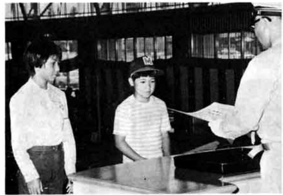
火災予防の功績で表彰の繁窪子供会の代表

管を設置して降雪時の火災に備えるための事業費と手引ポンプを積載車などに換え機動力配備。その置場と用地確保を国庫補助事業として採り上げてもらうよう関係官庁へ要望することを決議しました。 また、表彰式では、消防団以外の繁窪子供会が昭和十五年から一日も休まず、「火の用心」の夜巡りをしている功績が認められた表彰と、人命救助をした黒埼町の二人の女性も表彰されました。 このほか、消防に功績のあった消防団、団員の表彰に長岡市濁沢地内の地すべり、守門村大倉なだれ、湯之谷村下折立なだれなどの災害で尽力した消防団が県知事などから表彰されました。