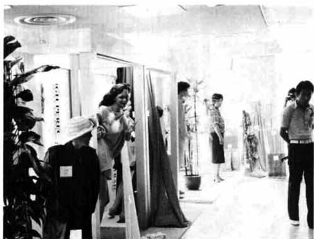
来年度の春夏織物展示会

栃尾でできた織物を素材に婦人服・子供服を主体にしたファッションショー、栃尾まつりに新しい趣向。26日、市民会館でチビッコからヤングレディーまでが装う、ワンピースやスーツを着こなしたモデルが、カラーのスポットライトに照らされ、勢ぞろいしました。栃尾織物の軽さとすぐれた風合い、色調を生かしたデザインで気軽に装えるものが主力。デザインと制作は、長岡文化服装専門学校の生徒があたり、モデルも同校の生徒さん。中には、市内から応募して、参加したチビッコモデルも登場して、栃尾まつりに密着した行事の感がありました。 繊維関係が不調といわれている中で、このファッションショーと織物展示会からは、何か明るいものが感じられました。