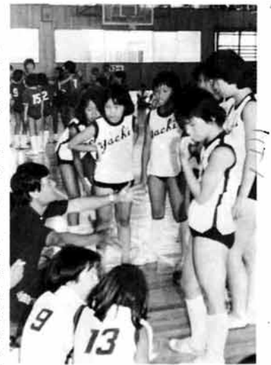
監督も真剣にアドバイス (ポートボール会場)

さる八月十六日・十七日の二日間にわたり、少年少女球技大会が開かれました。この大会は、青少年の健全育成をはかり、スポーツに親しむ機会を提供して健康で明るい市民性を育てようと、市教育委員会などが実施しているものです。二十一回をむかえたことは、一五チーム約一、八〇〇人の選手が参加しました。