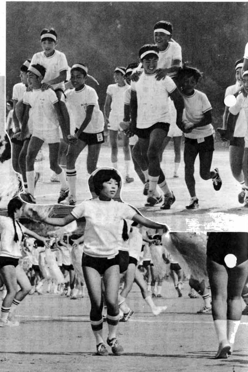
たくましく…… そして華麗に (栃中運動会)