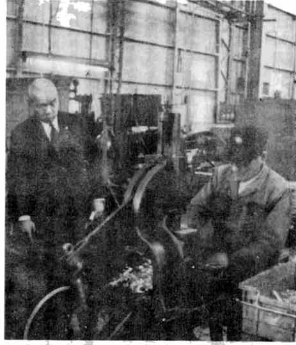
〔内市出身者は元気で働いている〕

市は一月二十六日から三十日までの五日間にわたり、関西、関東方面の出かせぎ先訪問を実施しました。 栃尾市からも毎年多くのかたが県外に出かせぎに出ていますが、ことしも職業安定所を経由して県外