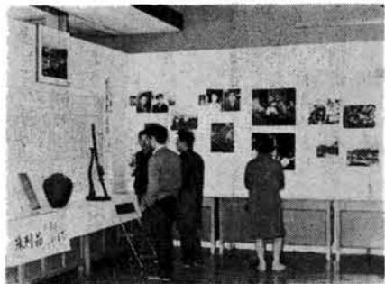
←「天と地と」写真展 昨年12月につづき、第2回目の「天と地と」写真展が、さる3月30日から4月3日まで、栃尾商工会で行なわれました。今回は、写真のほか陣屋セットや小型テレビカメラなどを展示。また地元からは上杉家ゆかりの太刀や栃尾城の瓦なども展示され、連日にごわっていました。