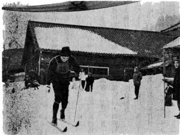
↑ 第28回守門スキー大会 28回目を迎えた守門滑降距離スキー新潟県選手権大会が、さる3月21日の春分の日に行なわれました。ことしから、大岳頂上から出発の予定であった距離競技は、悪天候のため万太郎に変更されました。