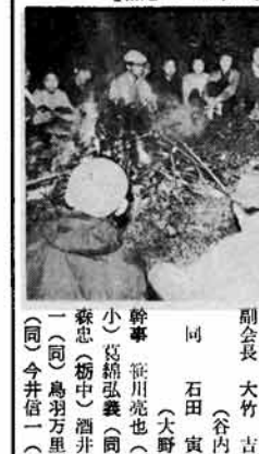
（指導者講習会に参加した市職員）