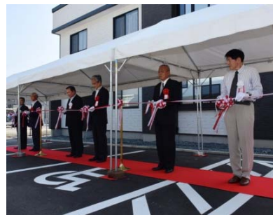
▲テープカットの様子