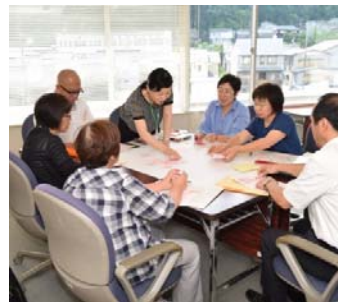
▲グループワークの様子