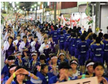
▲栃尾甚句を踊る人たちで埋め尽くされた谷内通り(8月23日)

第60回の節目を迎えた「とちお祭」が8月23・24日の2日間、盛大に行われました。23日午後7時にスタートした民踊流しには38団体、約2,300人が浴衣や仮装姿で参加。参加者の熱気とかけ声で大いに盛り上がりました。