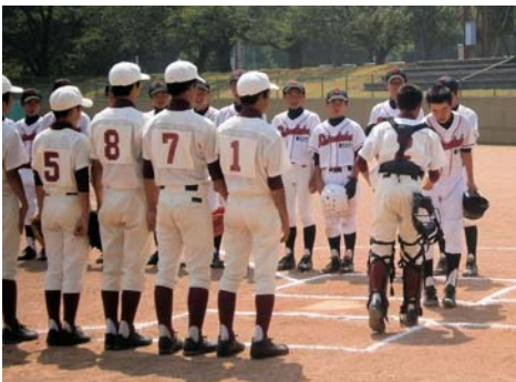
▲秋葉中学校対白鷹西中学校 (7月29日)

栃尾地域の姉妹都市・山形県白鷹町で7月29・30日に行われた野球親善交流会に秋葉・刈谷田中学校野球部が参加し、白鷹東・西中学校とそれぞれ試合を行いました。2日目の試合終了後にはカツカレーパーティーで親睦を深めました。