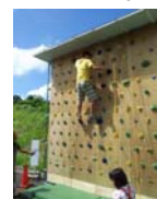
◀クライミング体験