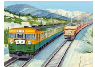
▲上越線の特急「とき」と急行「佐渡」