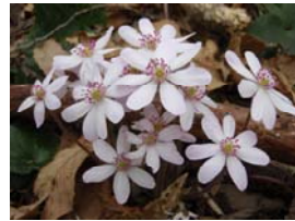
春の訪れを告げる雪割草