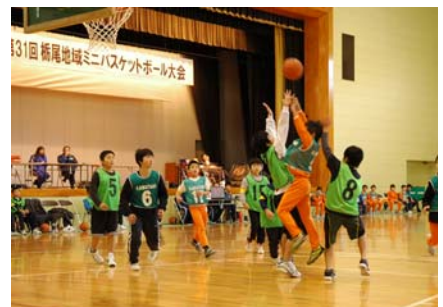
▲少年少女ミニバス大会に7チーム約100人が参加し、熱戦が繰り広げられました。(1月22日) 優勝：北荷頃男子 準優勝：KBC