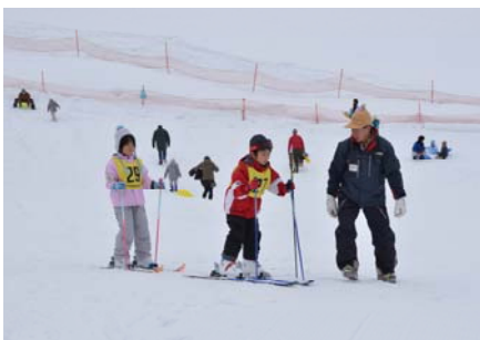
▲市民スキー教室がとちおファミリースキー場で開催され、2日間で小学生約60人が参加しました。(1月14・15日)