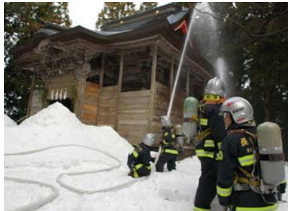
▲文化財防火デーに伴う消防訓練が羽黒神社(小貫)で実施され、地元消防団や消防署による放水訓練などが行われました。(1月22日)