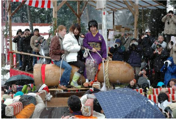
▶ 五穀豊穡や家内安全を祈願し御神体に乗る初嫁

越後の奇祭として知られているほだれ祭が、下伝で3月11日に行われました。今年の初嫁厄払いには市内外から5人が参加、重さ600kgの御神体みこしに初嫁が乗ると、大勢の観光客からフラッシュがたかかれていました。