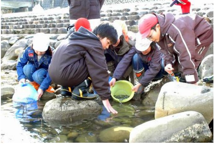
▶ 稚魚を放流する栃尾東小4年生

栃尾東小学校の4年生59人が3月16日、刈谷田川で鮭の稚魚を放流しました。この日は6cmほどの稚魚22,000匹が放流されました。参加した小学生は「泳いでいる姿がかわいい」「大きくなって、戻ってくればいいなと思う」と笑顔で話していました。