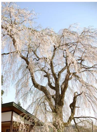
市指定文化財の「しだれ桜」

春のさわやかな風にゆれる樹齢100年のしだれ桜の下、栗山沢地区あげてもてなすやさしい祭り。演芸会と楽しい模擬店、ミスしだれ桜コンテストなどが行われます。