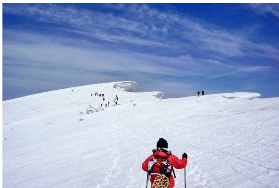
(空と雪庇のコントラストが大自然そのもの)