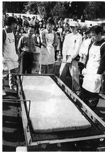
巨大あぶらげの完成

あぶらげ&コシヒカリ祭りが、杜々の森名水公園で行われました。天候に恵まれたこの日、会場を訪れた人は、過去最高の八千人。揚げたてあぶらげ試食や地元青年会のコシヒカリおにぎりやキノコ汁の前には長蛇の列ができ、買い求めた人たちは