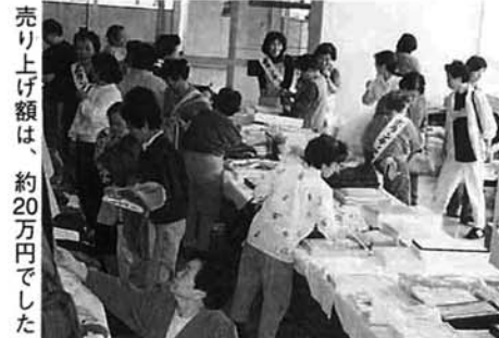
売り上げ額は、約20万円でした

ボランティア友の会チャリティバザー部会により、市民会館で開催されました。市民の善意により出品された物品は約千五百点。12時の開始とともに大勢の人が入場、事務費を除いた十五万三千円あまりを善意銀行を通じて栃尾の家に寄付しました。