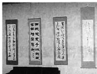
公募展で入賞した、市民の美術作品を文化センターに展示

文化協会は、市展・書き初め展の入賞作品を文化センターのホールに展示し、市民の皆さんから鑑賞いただいています。 作品の種類は、日本画・洋画・写真・書道・版画工芸で、種別ごとに二カ月間づつの展示です。