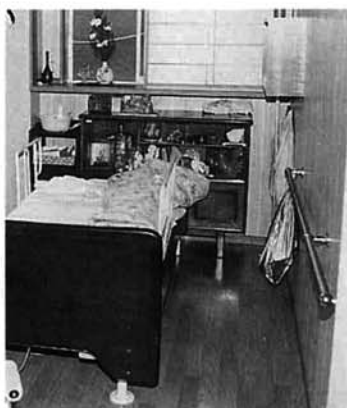
改修し、障害となる段差をなくして手すりをつけた住宅

度によってサービスの量や費用の限度額が決まります。現在、福祉による訪問介護(ホームヘルパー)を受けている人や施設に入所されている人も全員この介護認定を受けることとなります。ただし、現在施設に入所している人は、五年間は介護の程度にかかわらず入所できますが、この経過期間を過ぎると、介護の程度の軽い人(要支援と判定された人)は入所できなくなります。費用については、現在の福祉の制度では自己負担として所得に応じた負担をすることになっていますが、介護保険では、サービスを受けた費用の割を負担していただくこととなります。(例：要介護度1の軽度のケースの場合は月額費用が十四万円ですから、その割の一割の一万四千元の自己負担となります。ただし、低所得者には一定額以上は負担しなくともよい制度があります)