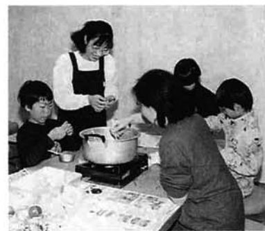
親子でアート・キャンドルづくり

内容 ブレンドワックスでいろいろなキャンドルを制作 とき 12月20日(日)14時~16時