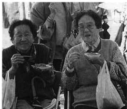
笑顔がこぼれる焼肉の試食

がでる店もあるほど。収穫の秋を楽しむ、両手にいっぱいのおいしい物をする市民でにぎわいました。