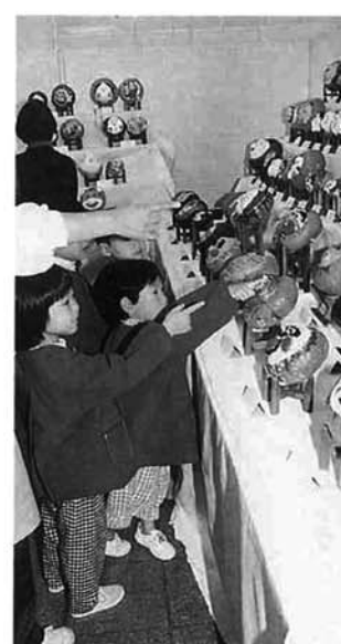
わたしの描いたかぼちゃ

今年の全国コンクールは、市内・県内をはじめ都道府県から四百五十五点の出品があり、全国規模のコンクールになってきました。また、十月二十日には、千葉県松戸市の「民芸かぼちゃ愛好会」の十一人が会場を訪れ、作品を鑑賞しながら交流を深めました。