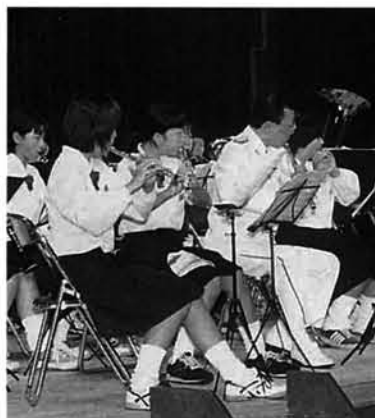
楽しい演奏を披露

式典終了後のアトラクションで、秋葉中学校、刈谷田中学校の吹奏楽部と県警音楽隊による演奏が行われ、会場の人たちを魅了させました。それぞれの演奏が