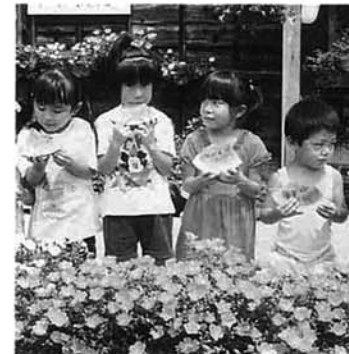
きれいに咲いたボーチュラカの前で

第31回新潟県花いっぱいコンクール「学校の部」で、西谷保育所が優秀賞を受賞しました。初めて県コンクールに出品しての快挙。花は守門の里からの苗と、さし芽や昨年の種から起こしたもので15種類。今年は鮮やかな花を咲かせることができました。