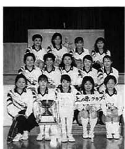
優勝を喜ぶ 上の原クラブのみなさん