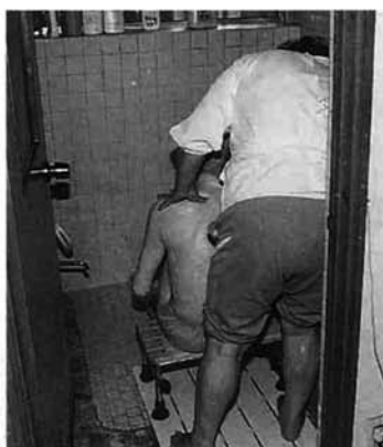
ホームヘルパーによる訪問介護。現在、利用している人も介護認定を受けることとなります