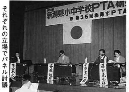
それぞれの立場でパネル討議

学校・家庭・地域社会・第四空間が連携し「生きる力」を子どもに根づかせようと、栃尾東小学校を会場に約八百人が参加して研究大会が開催されました。パネル討議や分散会で、PTAとしてやるべきことを熱心に協議しました。