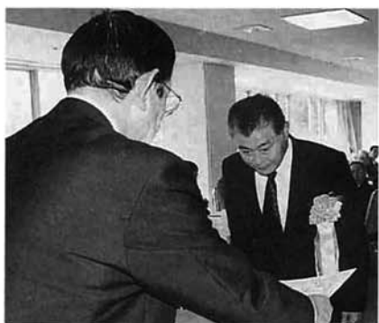
農業まつりの総合表彰式

また、市民会館と文化センターを会場に民謡のついでや小中学生の記念絵画展、農作物や錦鯉の品評会、芋料理展示、健康相談コーナー、植木市などさまざまなイベントが