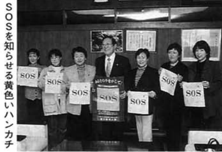
SOSを知らせる黄色いハンカチ

味覚の秋を楽しんでいました。今年から午前中に中野侯小学校六年生十一人が、午後から伝統芸能保存会のみなさんが、地元で伝わる「大寺」を、大勢の