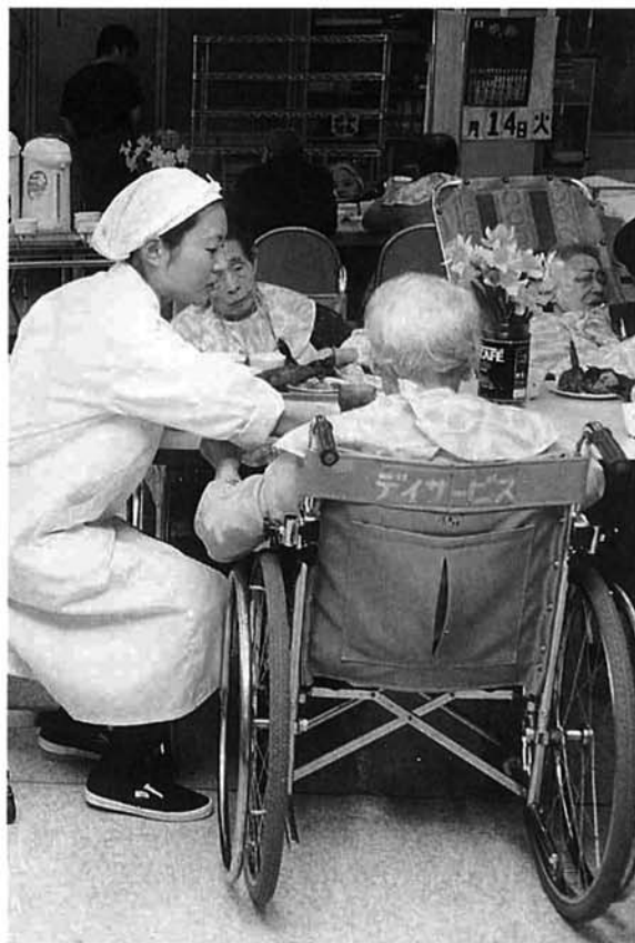
デイサービス施設を利用する人たち

市は、八月に六十五歳以上の人を対象にして実態調査を行い、市民の要望などをお聞きしました。この調査結果はこれから集計され、市民の代表などによる計画推進委員によって、介護保険事業計画に活かされます。実態調査で市民が感じた疑問点のなかから、主なものについていくつかお答えします。