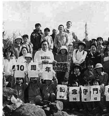
大岳頂上で記念撮影

創立10周年を記念して、刈谷田中学校の生徒・父母・教職員ら百七十人が守門登山を行いました。この企画は、生徒会とPTAの思いが一致して実現。郷土の名峰・守門岳に挑戦し、親子ともども記念の年に汗をかいてみようというもの。全員が無事登頂し、いい汗を流しました。