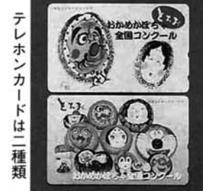
テレホンカードは二種類

9月27日のお絵かき教室には、約二百五十人が参加。初めての人も楽しそうに絵を描いていました。