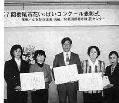
おめでとう、最優秀賞の三団体

とちお花企画は、今年も花いっぱいコンクールを開催。この度、花いっぱい写真展とコンク