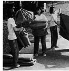
秋中の生徒20人が後かたずけの手伝い