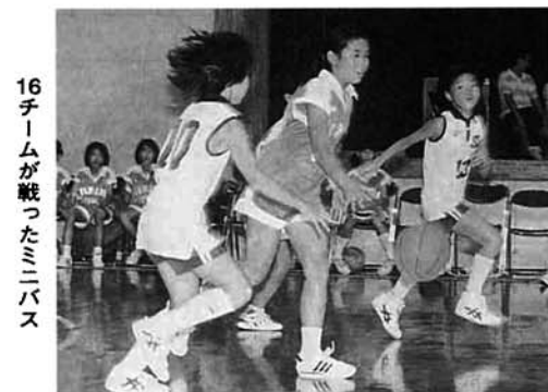
16チームが戦ったミニバス

第38回梶尾市少年少女球技大会が、小学生の野球は梶尾東・南小学校を、小学生のミニバスケットボールは総合体育館、梶尾東小学校を、中学生の野球は梶尾高校、秋葉中学校を、中学生のソフトバレーボールは刈谷田中学校を会場に行われました。四種目に五十チーム、六百七十五人が参加し、熱戦を繰り