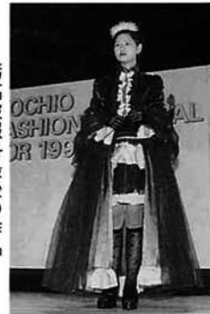
栃高被服科最後の作品