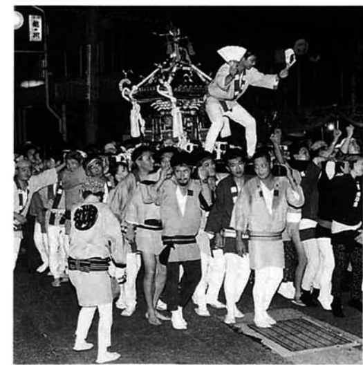
市民みこし。長岡市、見附市、中之島町、三島町など市外からも参加