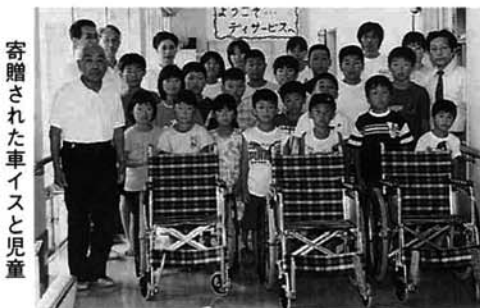
寄贈された車イスと児童

栃尾アルミの会の代表と一之貝小学校の児童26人が、8月1日にいずみ苑を訪れ、車イス3台を贈りました。