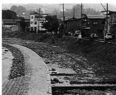
砂が流された河川敷(刈谷田川)