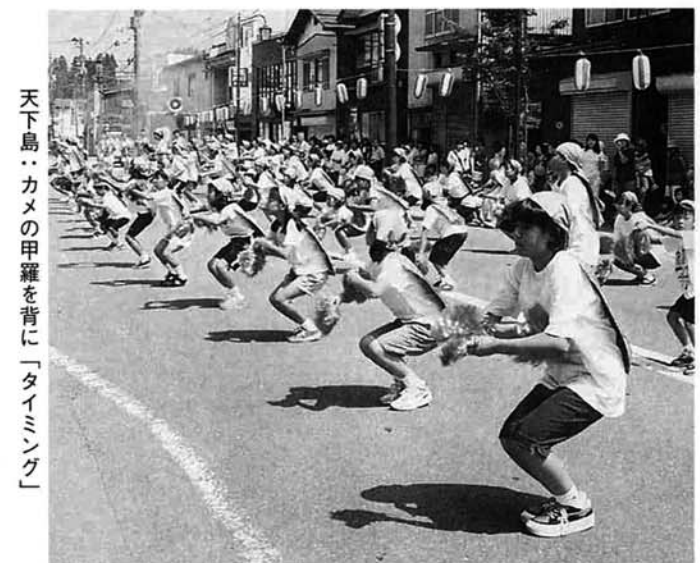
天下島：カメの甲羅を背に「タイミング」