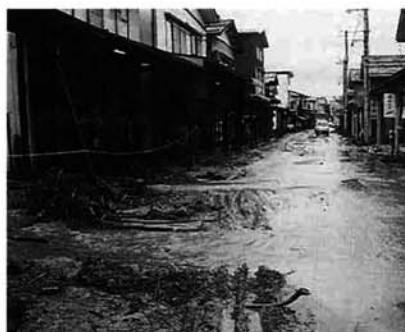
城山から土砂が流出した表町