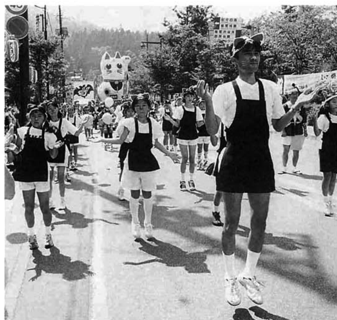
旭町：幸福をよぶマネキネコ