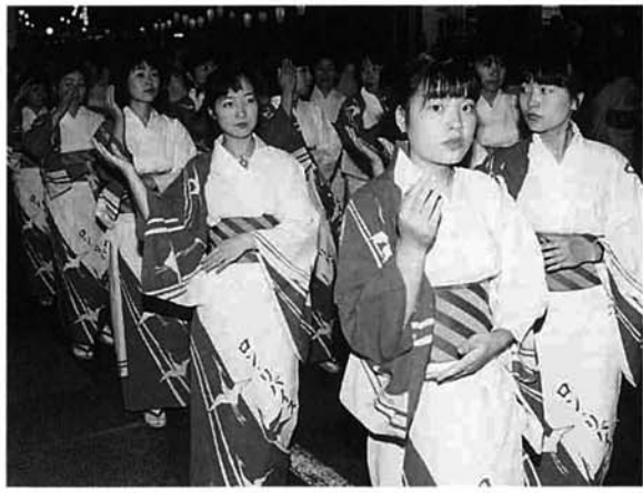
1,500人が栃尾甚句を踊りました