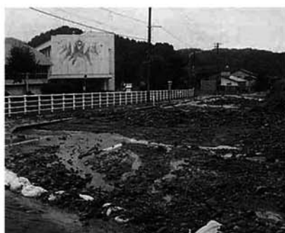
東谷小学校前の土砂崩れ