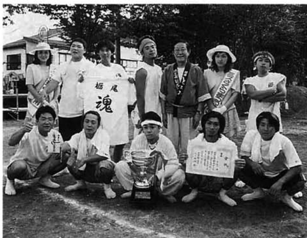
優勝した TEAM BEN Aチーム