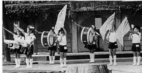
双葉保育園園児によるかわいい演奏