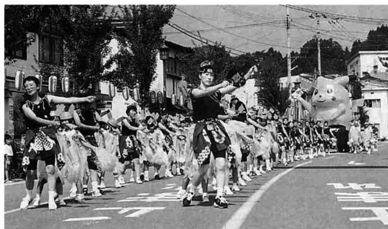
大野町：秋葉トンネル開通を記念してのピカチュー