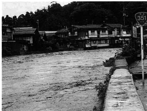
増水した神明橋付近の西谷川

新潟県内を襲った8.4集中豪雨は、市内でも各地で土砂崩れや地すべり、住宅浸水などが発生し、国道が通行不能になるなど大きな被害が出ました。