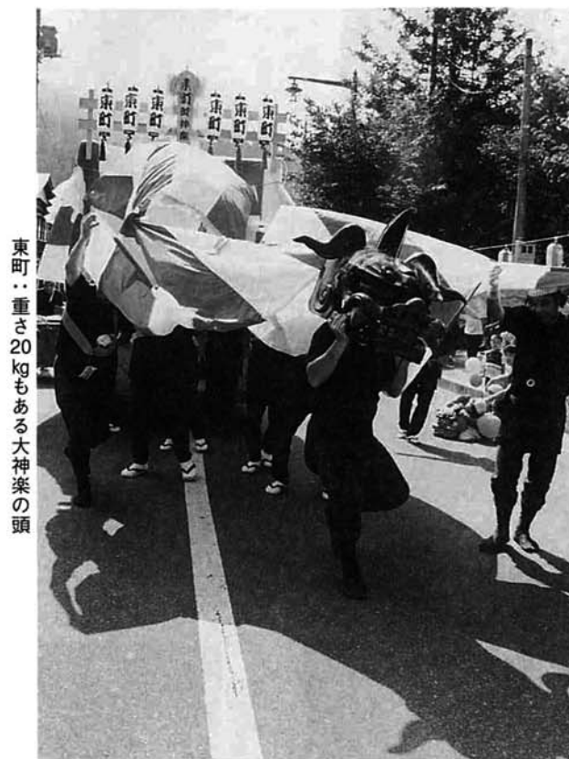
東町：重さ20kgもある大神楽の頭