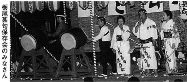
栃尾甚句保存会のみなさん