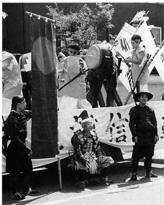
谷内1丁目：謙信太鼓と武者行列