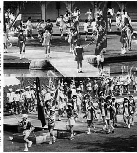
祭りのスタートは栃尾東小(上) 栃尾南小(下)の鼓笛