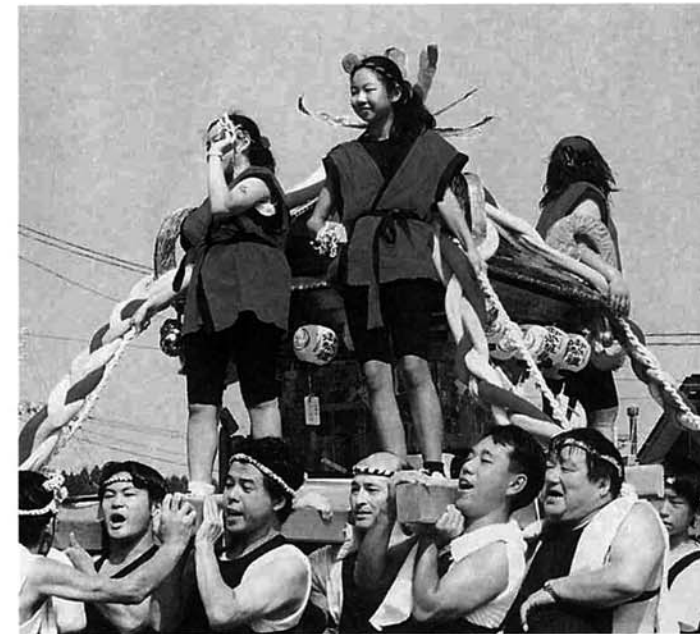
谷内2丁目：木札をまきながらの秋葉みこし