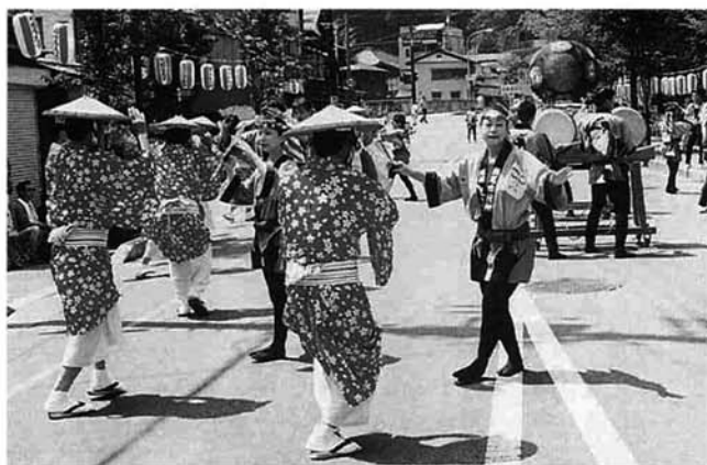
市役所：新・栃尾甚句くずし