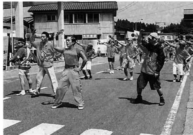
原町のプラビが「タイミング」を披露