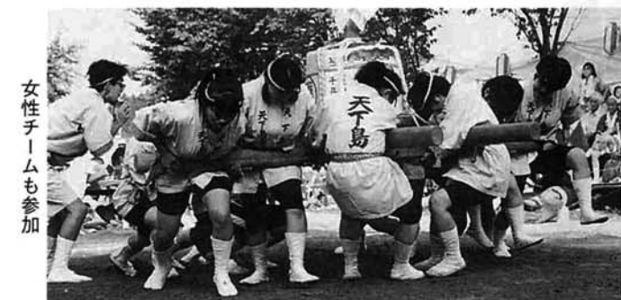
女性チームも参加