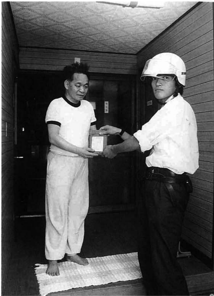
毎月配達される声の広報

毎月発行される「広報とちお」とは別に、視覚障害者のための「広報とちお」があるのをご存じですか。ボランティアの人たちによって録音される、「声の広報とちお」です。テープには優しさと励ましが感じられ、配達されてくるのが楽しみです…と利用者は喜んでいきます。