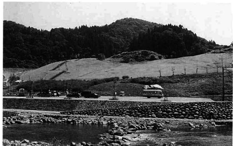
今年の冬にリフトが設置されるふるさと交流広場

この調査結果を検討した市は、ふるさと交流広場に二百二十四メートルのペアリフトを設置することを決定。今年の冬から運行できるように、準備を進めています。リフト料金は、市民の皆さんから多く利用していただくため、低料金を考えています。小中学校のスキー授業やご家族など、より多くの人の利用を期待しています。 また、市は、(株)コクドが計画している守門岳スキー場の早期事業着工を要望しています。しかし、会社側としては、アクセス道路の設計や民地部分の設計など、もう少し時間が必要としています。