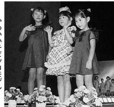
かわいいチビツコモデル