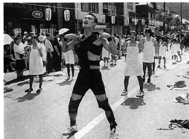
本町：今年も見せてくれました。本町の大変身