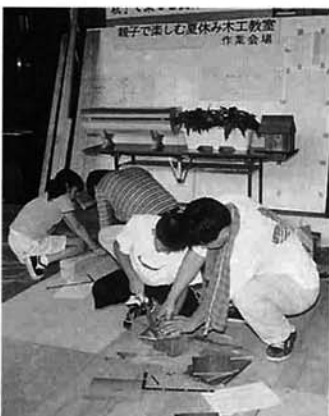
今日はお父さんとっしょ

夏休みにお父さんと一緒に、のこぎりやかなづちを使って工作を楽しもうと栃尾木材組合が主催した木工教室。会場の総合体育館には、30組が参加し親子で力を合わせて、素敵なプラントーや鳥の巣箱を完成させました。