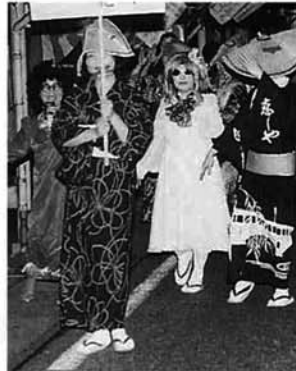
仮装しての参加者