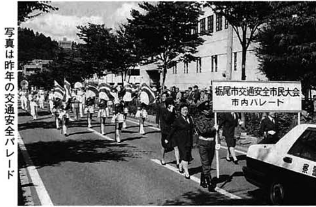
写真は昨年の交通安全パレード

日時▶ 10月9日(金) 午後2時～3時 会場▶ 保健福祉センター(新栄町2-2-23) 問合せ▶ 長岡保健所☎33-4931