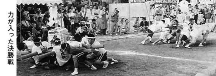
力が入った決勝戦