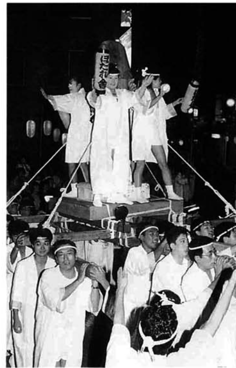
「しよいや、しよいや」とちおほだれ舎