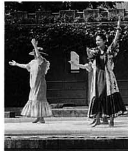
長岡からフラダンスが参加