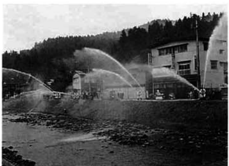
西谷川堤防での放水訓練

今年の消防防災訓練は、九月七日午前五時四十五分ごろ、栃尾市においてかなり強い地震が発生したという想定で、新町、大町地内で行われました。地震により家屋が倒壊し、火災も発生。走行中の車両数台が衝突し負傷者がでている。また、所々で道路が寸断され、水道、電気、通信などの施設にも甚大な被害が生じているという想定のもとに約四百人、二十九台の車両が参加しました。