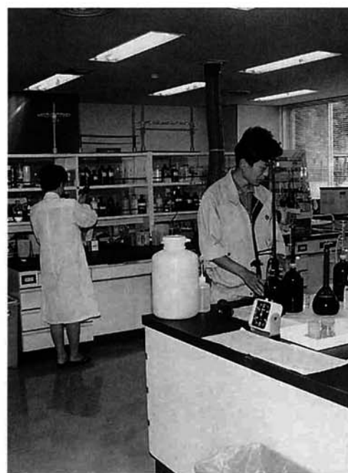
下水処理センター「水質検査室」は、流入する水・放流する水を毎日検査、安全を確認しています

画区域の整備は今年度で終了の予定です。市街地周辺部の工事も始まり、また、農業集落排水事業で川谷地区と塩谷地区も整備事業を開始しました。平成八年度末で、整備面積は