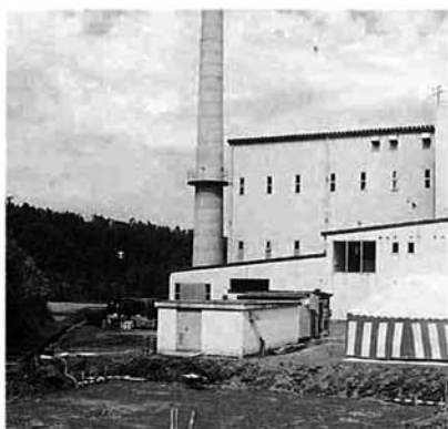
着工した繊維くず焼却場

これまでの繊維くず焼却施設が老朽化したため、新たにクリーンセンター内に繊維くず焼却場の建設が始まりました。