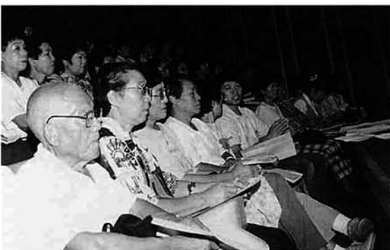
多くの方が傍聴しました