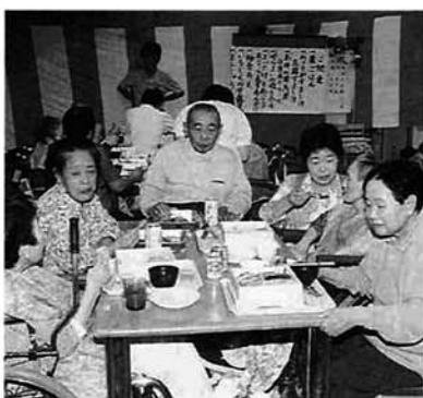
家族と一緒に昼食

特別養護老人ホーム「いずみ苑」では、入所者全員が参加して敬老会が開催されました。い