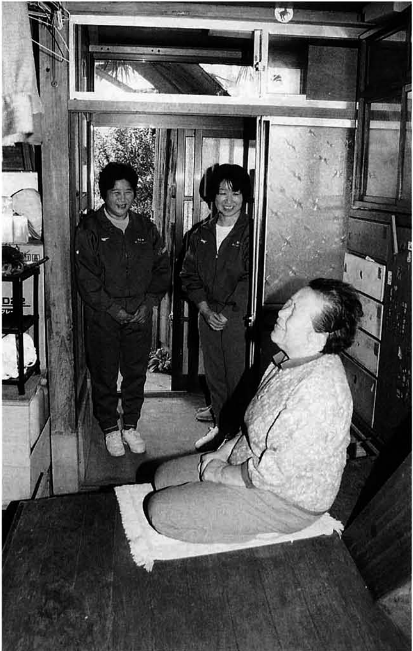
ひとり暮らしや、老人世帯を安否確認訪問するホームヘルパー。近所の住人もときおり顔を見せて、一声かけてくれています。