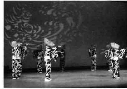
昨年の芸能祭での踊り

※母子手帳を忘れずに持参してください。 ※予診票は、必ず記入してきてください。(体温は会場で測っていただきます。) ※別冊の「予防接種と子どもの健康」を必ず読んできてください。