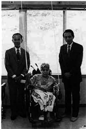
助成で購入したリハビリ器具

第四銀行は、創立百二十周年を記念して、社会福祉施設へ助成しています。今年はいずみ苑を含む三十八施設に助成。いずみ苑は、この助成金でリハビリ器具を購入し、入所者たちのリハビリに役立てています。