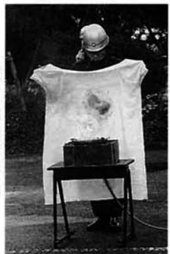
天ぶら鍋の消火訓練