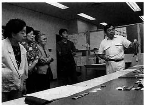
中央監視室で説明を聞く

9月の下水道月間にちなみ、市政バスで下水処理センターを訪れました。担当職員の説明を聞いたあと、施設を見学し、汚水が科学的・衛生的に処理されて、きれいな水に生まれ変わっていくようすがわかりました。