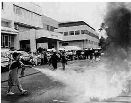
消火器による消火訓練

会場を市民会館前に移し、消火器を使つての消火訓練が行われました。この訓練には、今年二月に市と災害時の協力協定を結んだ郵便局の職員が初参加。消防署員の説明のあと郵便