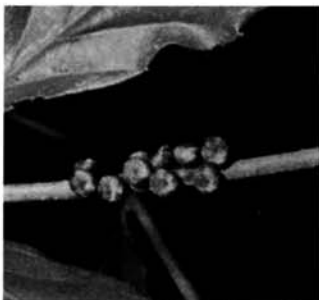
ヤママユの卵 (直径約2.5mm)

幼虫は頭が緑色、胴部は淡緑色で、成長すると七十〜九十mmにもなります。幼虫は葉を集めてまゆをつくりまゆから、少し緑がかつた丈夫な絹糸（天蚕糸）がとれます。以前は、この糸をとるために飼育されていました。また、天蚕糸と書いて「てぐす」と読ませることがあります。つりに使う糸です。これは、フウサン、もしくはクスサンなどのヤママユガの仲間のガの幼虫の糸をつくる器官から、細くて透明で丈夫な糸を取り出して釣りに使っていたためです。