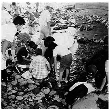
河川を調査する小学生 (刈谷田川)

む川になってきています。快適な水洗トイレは、子どももお年寄りも安心して利用することができ、悪臭に悩まされることもなくなりました。また、汚いドブやミズが無くなったためカやハエが発生しなくなり、いっそう清潔な生活環境になっています。