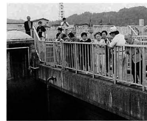
下水道施設の心臓部「終末処理場」

早めの工事には 奨励金が支払われます 排水設備の工事は、市が下水の処理開始を告示した日から三年以内に行っていたら、早く工事を行った人には、奨励金をお支払いたします。