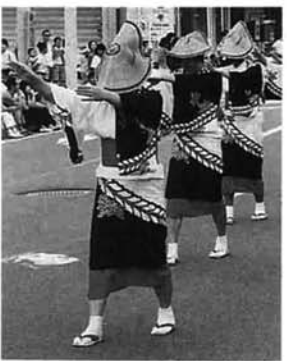
名前の由来は、笠踊り