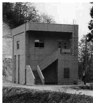
山の中腹に完成した浄水施設

機にトイレの水酸化など家庭の生活環境を整備したい、という声も多く聞かれました。 「つぎは地域おこしだ」 「まんさく地区」の総合整備事業は、このほか、農業の基盤である農道、用水路、暗渠排水、ほ場整備の工事も着々と進んでいます。また、地域活性化を図る活動拠点の建設も平成十年以降に計画されています。 こうしたハード面の整備とともに、今後は地域をみんなのアイデアでどのように活性化しようとするのが課題です。西谷五集落は、名実ともに「まんさく地区」となるよう、住民の知恵を出し合って地域おこしを進めようとしています。