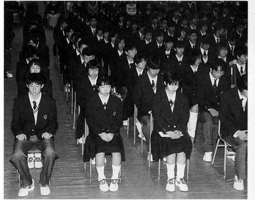
入学した7クラス、280人の総合学科一期生たち