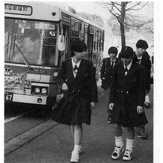
通学バスの便もよくなりました

多様な学科で生徒のニーズに対応 栃尾高校で開設する総合選択科目は、七つの系列があり、興味・関心・適性・進路などに応じて学習したい科目を効率的に選択します。開設する科目は総花的にしないで、指導スタッフの専門性を考慮しながら、科目を設定。スタンダードな科目ではあるが、進学など多様なニーズに対応できる授業運営をやるという考えです。一年次の総合選択二単位は七系列の頭だしとも言えるもので、七科目から一科目を選びます。今年の専門学科系の科目は、二クラス展開になりました。これは生徒が総合学科に幅広い期待