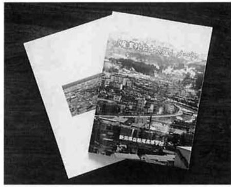
高校が作成したサブテキスト「産業社会と人間」ノート。職業生活や現実の産業社会のしくみなどを、主体的・体験的に学びます