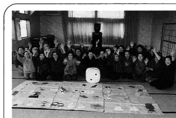
大勢の仲間とゲームを楽しむみなさんの笑顔はすてきです。

ユニークな活動を応援します ふるさとづくり推進補助事業 市では、地域や団体などが自ら考えて行う地域づくり活動の経費の一部を助成しています。これまで、二〇〇の地域や団体が活用し成果をあげています。今年度も引き続き、この事業を実施しますので、地域づくりに役立ってください。