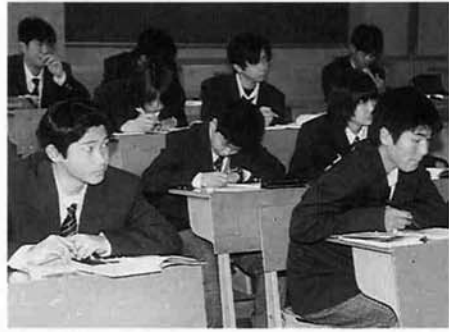
選択科目の授業は、1クラス27人くらいの少人数です