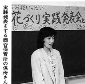
実践発表をする西谷保育所の保母さん

昨年の栃尾市花いっぱいコンクールで、最優秀賞に輝いた三団体の代表者から、「夏に水をやらないと花が枯れてしまうため苦労したが、花への思いやりを育てることができた」、「草を取っていたら、大きなミミズが出てきてビックリした」などの実践発表がありました。