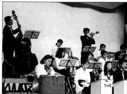
楽しいジャズを演奏するウィンドアンサンブル

王宮のイメージの室内楽、日本人の心を歌う混成合唱、楽しいスウィングジャズ、ラストはクリスマスキャロルを演奏。素敵なホワイトクリスマス演奏会でした。