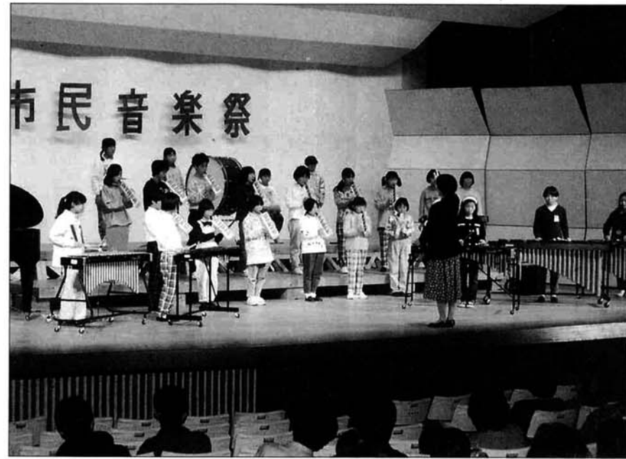
「つばさをください」「となりのトトロ」を演奏する東谷小学校のみなさん

十二月六日、北越銀行の職員有志で組織している「北銀まごころの会」が、地域貢献活動の一環として、とちの木の家へファンヒーター一台とロッカー二台を寄付しました。