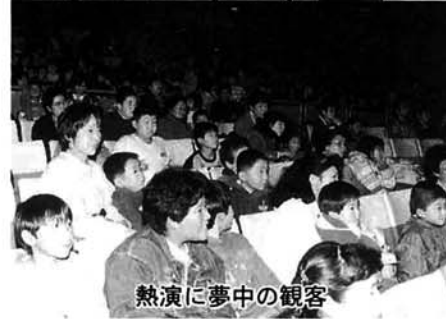
熱演に夢中の観客