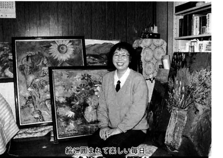
絵に囲まれて楽しい毎日

く習慣で。感性はもともと誰もが持っているもので、良い絵をみたり経験を積むことによりおのずと磨かれてきます。 細かいテクニックなど気にせず、思いついたときに書いてみる。生活の中に絵があるという感覚はすばらしく、仲間が増えればもっと楽しいですね。 今年の八月に市立美術館が完成の予定ですが、たくさんの人たちが使えるものであってほしいと思います。私たち市民の夢が生まれる「ふるさと美術館」に期待しています。