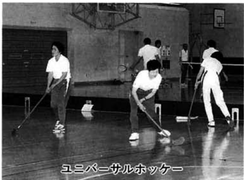
ユニバーサルホッケー

本ずついでいねいにカヤを巻きました。しっかりとした添え木にも支えられ、今年の冬も無事に過ごせそうです。