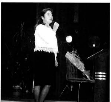
すばらしい歌声に拍手喝采

栃尾歌謡クラブ主催のチャリティーショーが、市民会館大ホールで開催されました。プロ顔負けのすばらしい歌と踊りに観客からは拍手喝采。集まった十三万九千二百二十八円は、歳末たすけあいに寄付されました。