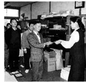
とちの木の家のみなさんに手渡されました。

秋葉中学校生徒会では、十月十六日の文化祭で、家庭の用品などを持ち寄りチャリティーバザーを実施。収益金七万三千七百一十円を福祉活動に役立ててほしいと寄付いただきました。