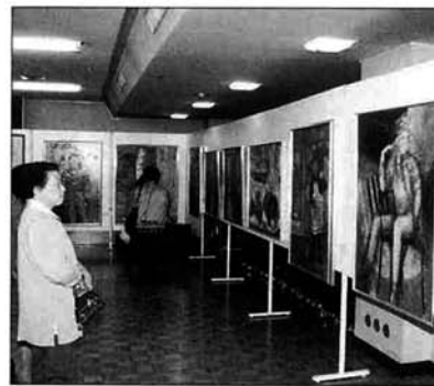
イタリア、スペインを題材にした油彩が数多く展示されていました。

絵画グループ「一洋会」は、結成して二十九年目を迎えます。おもに栃尾高校美術部の卒業生がメンバー。イタリアやスペインへの写生旅行など活発に活動しています。今回も個人的な大作が展示されていました。