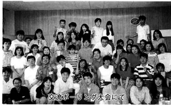
交流ボーリング大会にて

職場の先輩に誘われて青少年ホームを利用するようになりました。体を動かすことが好きなので、いろいろなことにチャレンジしています。現在はパドミントンとテニスのサークルに入っています。 ホームでは主に、生花や茶道などの教養講座、テニスなどのクラブ活動、スポーツ大会や紅葉祭などのホーム行事を行っています。年間を通じてたくさんの催し物があって本当に楽しいところですよ。 最近では少人数のグループ内だけでなく、そのグループが集まって行動することも増えていきます。大勢だとたくさんの人と知り合いになれるので違ったおもしろさがあり、仲間を作るには最高のチャンスです。また、自分たちで企画運営するので、スタッフとしての充実感も味わえます。 栃尾には結構若い人がいるんですね。特に今年には地元就職者が多かったのもよく見かけます。その人達にもホームの仲間に入ってほしい、いっしょに活動して栃尾の良さを発見して行きたいと思っています。 ホームが新しく建て替えられる予定ですが、利用しやすい施設になることを期待しています。