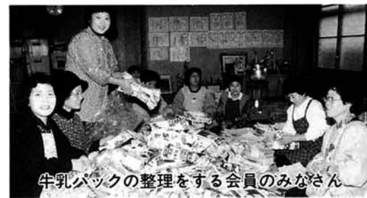
牛乳パックの整理をする会員のみなさん