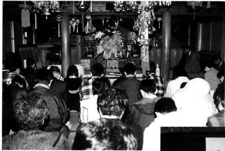
▲必ず合格しますようにと熱心に祈る受験生たち