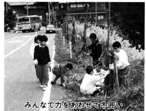
みんなで力をあわせて冬囲い

平成四年十一月に国道二九〇号沿いに植えられた、しだれ桜の冬囲いが行われました。今年の夏の少雨にも耐え、すくすくと育った桜に、栗山沢小学校の生徒と集落の人たち、そして東北電力㈱の協力を得て一