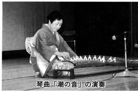
琴曲「潮の音」の演奏

栃尾市スポーツ少年団では、参加団体の親睦を目的に交流会を開催しています。今回は普段、いろいろなスポーツに取り組んでいる子供たち100人が集まり、ドッジボールや紙飛行機飛ばしをして友情を深めました。