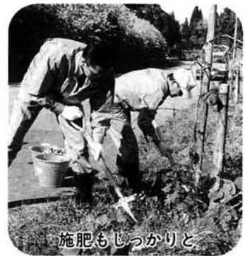
施肥もしっかりと

平成四年十一月に国道二九〇号沿いに植えられた、しだれ桜の冬囲いが行われました。今年の夏の少雨にも耐え、すくすくと育った桜に、栗山沢小学校の生徒と集落の人たち、そして東北電力㈱の協力を得て一