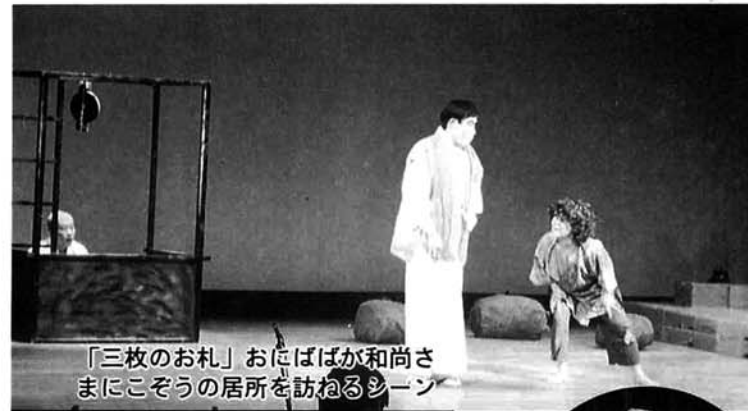
「三枚のお札」おにばが和尚さまにこそこの居所を訪ねるシーン