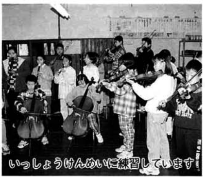
いっしょうけんめいに練習しています