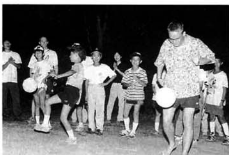
ドイツスポーツ少年団との交流会

めて知るドイツの人たちに国民性の違いを実際に肌で感じることで、また、地元スポーツ少年団の密接なチームワークが生まれたことなど収穫がたくさんありました。 栃尾では剣道、柔道が盛んですが、他のスポーツのレベルアップも必要です。そのためには、交流会や研修会などを通して専門的な知識の習得、指導者の資質の向上が不可欠です。加盟団体が増えれば、より多くの活動が可能になります。栃尾のスポーツ団体が、大きなスクラムを組む日を夢見ています。