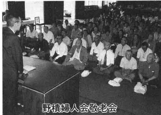
野積婦人会敬老会