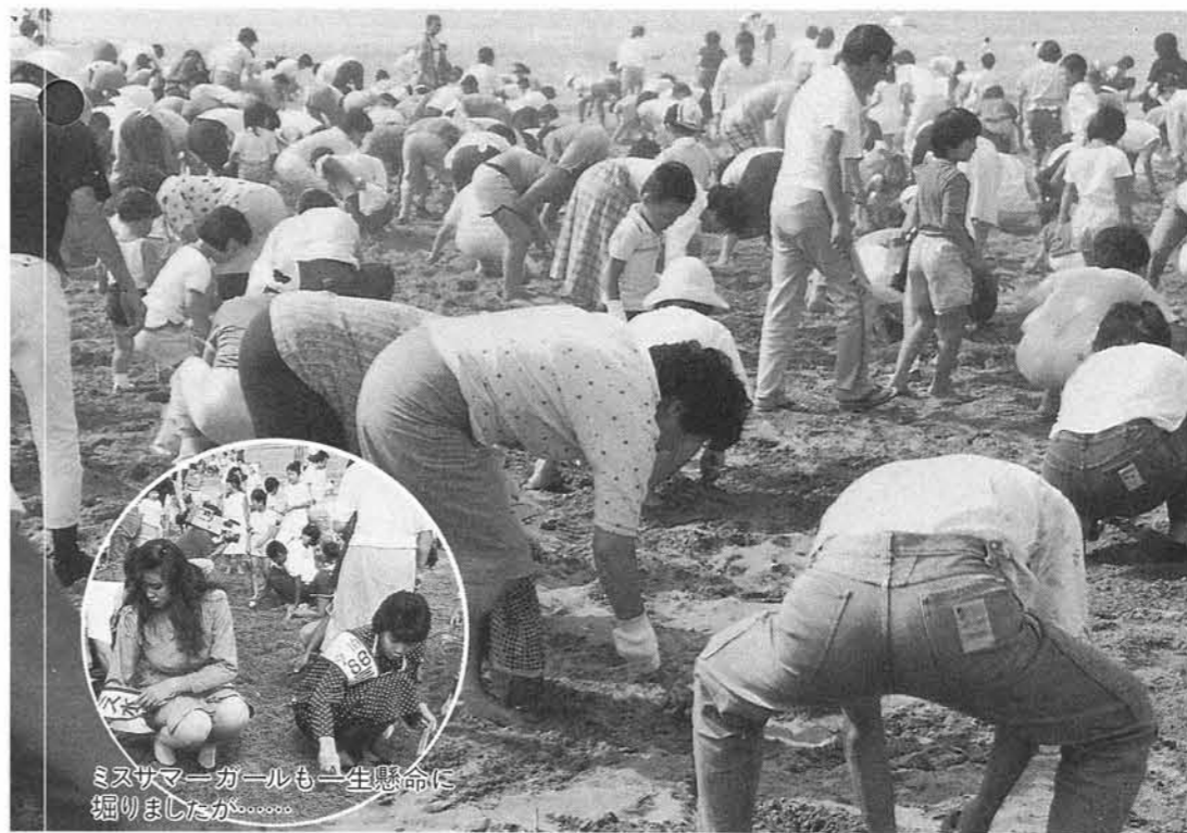
ミスサマーガールも一生懸命に掘りましたが……