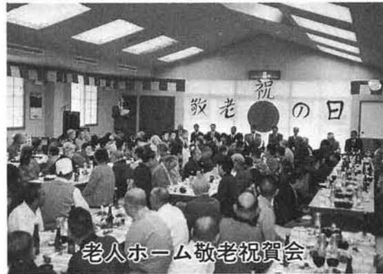
老人ホーム敬老祝賀会

長年にわたり社会に貢献されてこられたお年寄の長寿をお祝いしようと各地で敬老会が開催されました。 敬老の日の15日は、午前10時30分から町体育館で、寺泊婦人