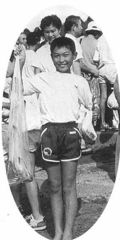
「ほく、こんなに大きな鮭があつたよ!」

その成果は大漁の人から、アメ横で補充しなければならぬ人までさまざまで、小一時間の砂浜決戦は色々な思い出をのこしました。秋の風と汐の香のオゾンの中で日ごろのストレスを解消して帰途につく時「来年も又来ます。」という顔は、満足感でいっぱいでした。