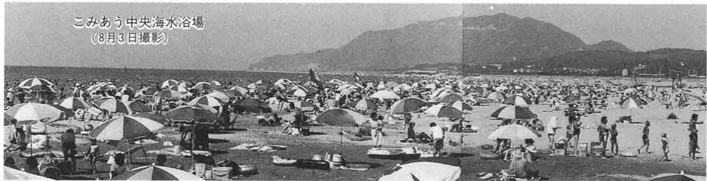
こみあう中央海水浴場 (8月3日撮影)

夏のシーズンを終りましたが、すっかり観光ルートに定着した「寺泊」です。これから秋のシーズンを迎え、又、来年の夏も今年以上の入込みが予想されます。観光の町として受入態勢の充実を図らなければなりません。