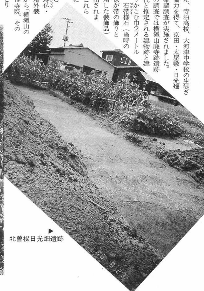
北曾根日光畑遺跡

の皆さん、寺泊高校、大河津中学校の生徒さん達の協力を得て、京田・太屋敷・日光畑遺跡の確認調査が実施されました。 今回の調査では横滝山廃寺跡遺跡と同時代と推定される建物跡と建物とをとりかこむ巾2メートル程の溝、石帯様石(当時の高級官僚が帯の飾りとして使用した装飾品)等が検出されました。これらとすでに発見されている 鷗尾・博伝・木造基壇外装遺構等から「横滝山の台地には寺院、その寺院をとりかこむよう に堀をめぐらした高級官僚の建物」が存在したのではないかと推定されています。 益々「初期越後国府立証への夢がふくらみ一日も早い全容の解明が期待されます。