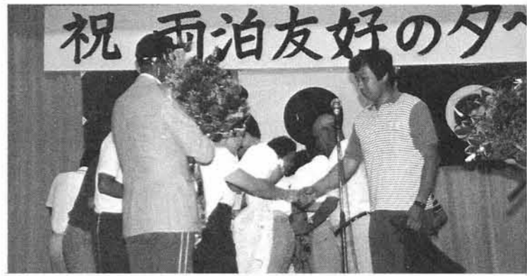
▲親善を深めあう「両泊友好の夕べ」

37回目をむかえた両泊親善体育大会は、当町を会場に7月19日・20日の2日間にわたり陸上競技をはじめ、野球・ゲートボール・バレーボールなど10種目に熱戦がくりひろげられました。 まだ、梅雨あけもしないため、毎日シトシトと降っていた雨もこの日はやはり両泊大会を歓迎するかのようにスカッと晴れ、盛夏を思わせるような晴天になりました。今年の大会は、長年の願望であった両泊航路が1日2往復となったため、今までは新潟まわりで帰村されていた赤泊村選手団は寺泊港発4時30分の「さど丸」で寺泊をあとにしました。そのため閉会式終了後もゆつくりと選手間の親善を深める中で、来年の赤泊村での再会を約しました。