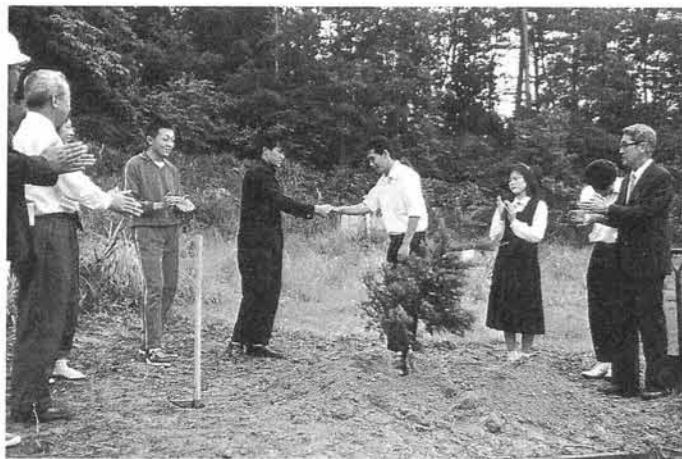
▲記念樹を植樹する両校代表