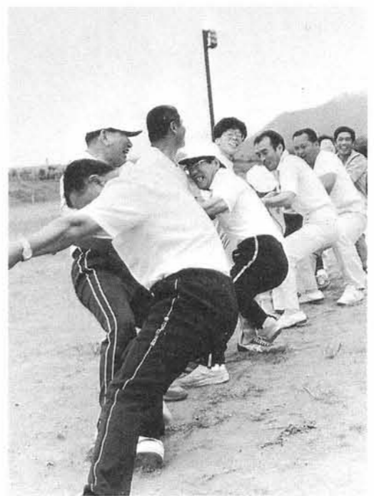
▲種目の最後をかざるにふさわしい力の入った綱引き

37回目をむかえた両泊親善体育大会は、当町を会場に7月19日・20日の2日間にわたり陸上競技をはじめ、野球・ゲートボール・バレーボールなど10種目に熱戦がくりひろげられました。 まだ、梅雨あけもしないため、毎日シトシトと降っていた雨もこの日はやはり両泊大会を歓迎するかのようにスカッと晴れ、盛夏を思わせるような晴天になりました。今年の大会は、長年の願望であった両泊航路が1日2往復となったため、今までは新潟まわりで帰村されていた赤泊村選手団は寺泊港発4時30分の「さど丸」で寺泊をあとにしました。そのため閉会式終了後もゆつくりと選手間の親善を深める中で、来年の赤泊村での再会を約しました。