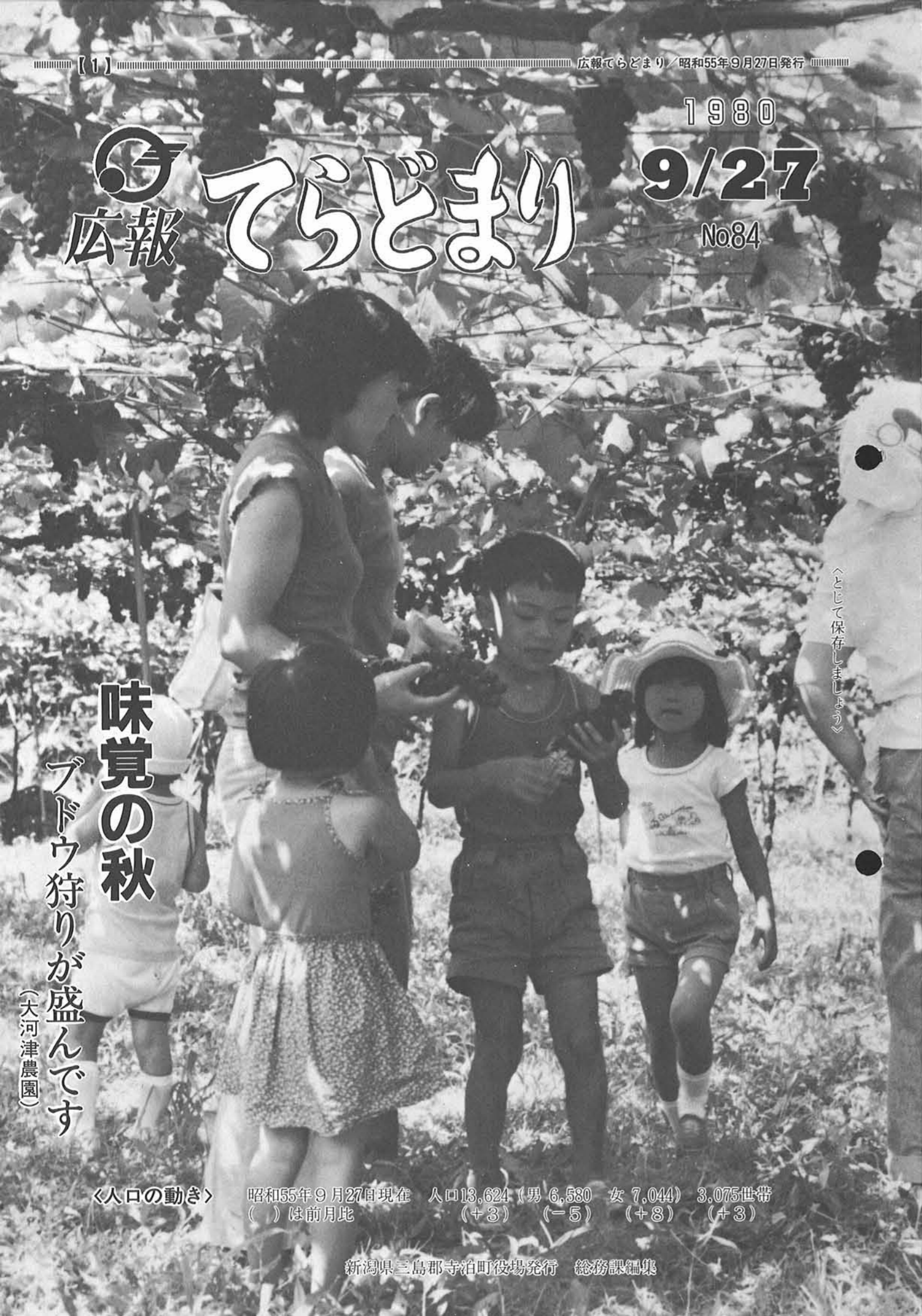
へとして保存しましよ