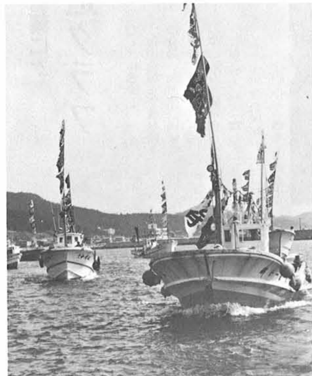
寺泊港を中心に行われた船団パレード（漁民の心意気）