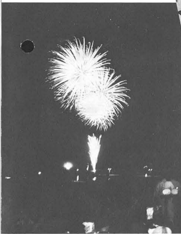
7日夜行われた海上花火大会

町民総参加で楽しむまつりをスロ ーガンに行われた「港まつり」は、八月 六日・七日にわたって行われ、町内は祭 り一色となり、おけさ流し、花火大会な ど見物客でにぎわいました。 前夜祭の六日は、大海供養にはじまり、 鼓笛隊パレード、ブラスバンドパレード、 とつぎ華やかな寺泊おけさ流しが、雰 囲気を一層もりあげました。 七日は船団パレード、海上大花火大会 が行われ、さまざまな光の花が夜空をい ろどり、多勢の見物客から盛んに声援が 送られていました。 協賛行事として「寺泊サマーフェステ イバル」が行われ、ウルトラマンショー、 ミニSL運行、バザール、歌謡チャンピ オン大会など、港公園で大人もチビッコ も大活躍でした。