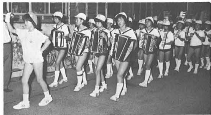
寺小児童による鼓笛隊パレード