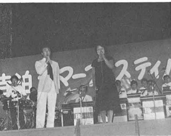
熱いデュエットで寺泊ナイトクラブ…