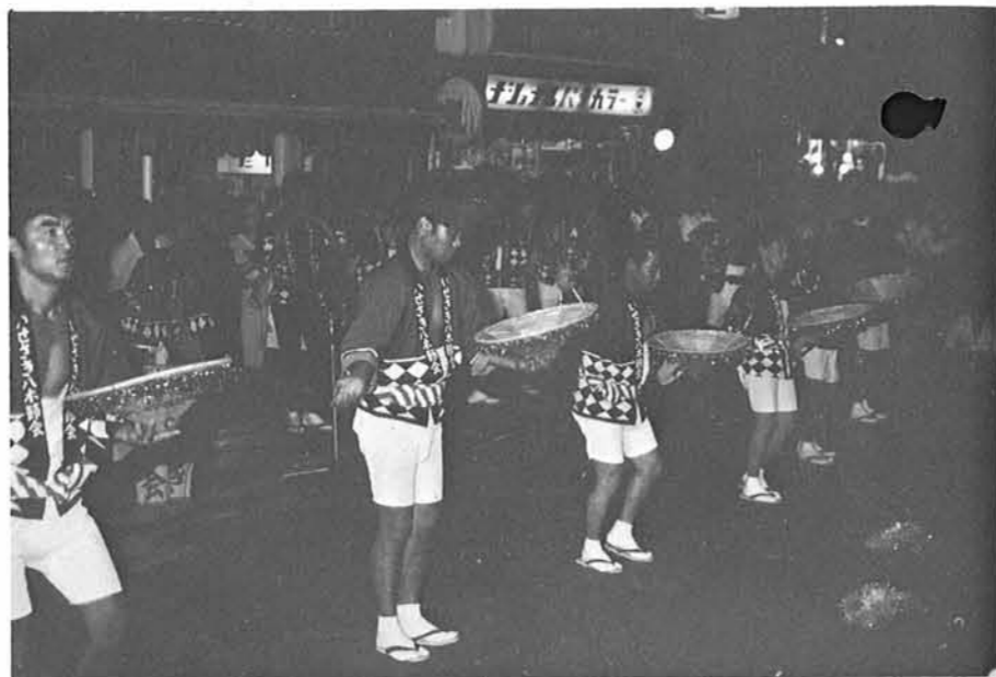
友情出演 伊勢崎市役所職員による八木節