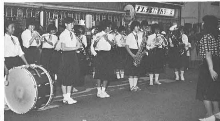
寺中生徒によるブラスバンド演奏