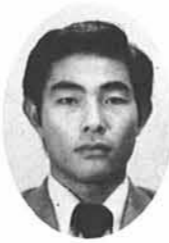
町四郎 沢健 三

十六日の選挙は、一番身近であるだけに、真剣にのぞまなければならぬ、が考えれば考えるほど疑問を抱き、何に重きをおいてのぞんでいいかわからないのが事