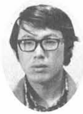
吾省 森 竹田

選挙といっても、いつもあまり考えないで投票してしまいます。誰が当選しても、今の私の生活に大きな変化があるのではないし、棄権しても同じと思いがちながら、