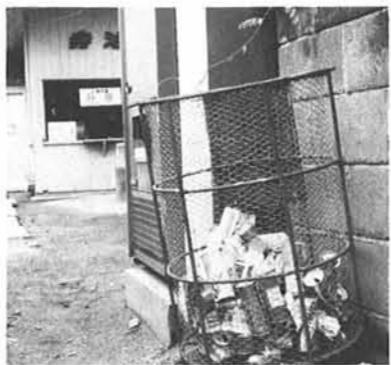
▲このようにキッチンとゴミ入れの中へ

また先日、分水町のダイビングクラブの方が防波堤近くを潜ってみたら空カン、空ビンなどで海の