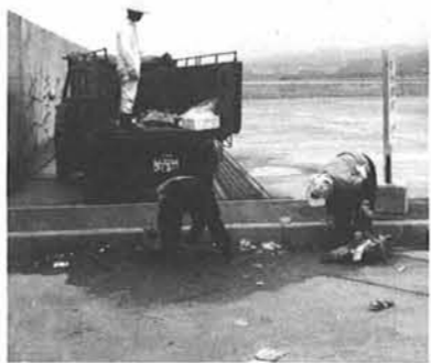
▲収集作業は、はかどらずたいへんです。

なぜ、こういった捨て方をするのかという疑問がわいてきます。捨てられているゴミの中には、キッチンとビニール袋に入れて捨ててあるものもあり、ここまでして捨てるならチョット歩いてゴミ入れの中に捨ててくれればよいものを。ゴミ入れが不足なのだろうかと思えてきたら、両方の港公園、フェリー登岸所周辺、水族館周辺、海浜公園周辺には決して不足とは思えないくらいゴミ入れが備え