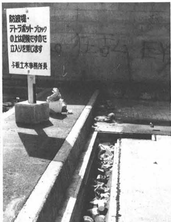
側溝の中はごらんとおり 空カン、カップラーメンの空容器でいっぱい