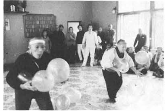
◀「所得倍増レース」でおばあちゃん「倍増」ならず

去る十二月十六日、寺泊老人ホームでは室内運動会がおこなわれました。 この運動会は、とくくになりがちな運動不足を解消しようと計画されたもので、お年寄りの中に職員もまじり、赤組、白組にわかれて「所得倍増レース」や風船を入れたザル引きレースなどがおこなわれました。 ゲームはすべてお年寄りの体力に合せてあり、得点するたびに大応援団を練りだすなど、応援合戦にも熱が入り、「明治青年」もこの日はかりは童心にかえり、楽しい一日を過ごしました。