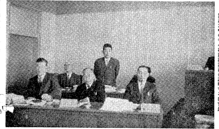
論議中の寺小校舎改築計画を説明する教育長

千六百八十八万円で前年比千六百八十八万円で前年比としてこのうち商工振興に七百万円、観光振興費三百三十二万円、水産振興費四百四十二万円等であり商工、観光一体となつて観光寺泊の発展を計りたいものであります。