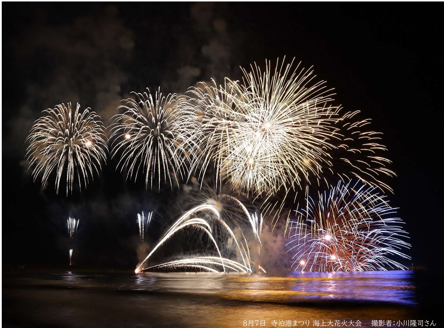
8月7日 寺泊港まつり 海上大花火大会

■発行／編集■ 長岡市寺泊支所地域振興・市民生活課 地域振興・防災担当 ☎0258-75-3111 FAX 0258-75-2238 E-mail tr-chiiki@city.nagaoka.lg.jp