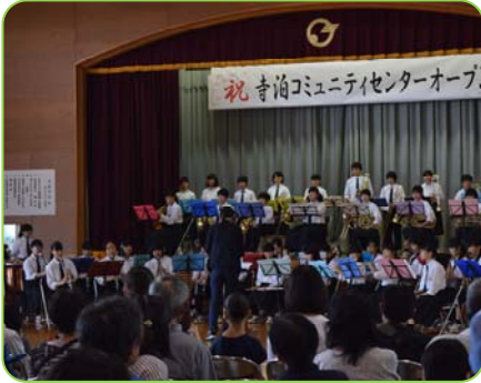
▲寺泊中学校 吹奏楽部

ステージ発表では、歌あり、踊りあり、漫談あり！出演団体が観客を楽しませてくれました。屋内では、トキの折り紙教室やスライム作り体験、紙飛行機飛ばし大会などを開催。屋外ではおいしい屋台村でお腹を満たし、陸ガメと遊んだり、地震体験車や濃煙体験ハウスでの防災体験もありました。(6月23日) コミュニティセンターを地域の交流拠点「いこいの場」として、お気軽にご利用ください。