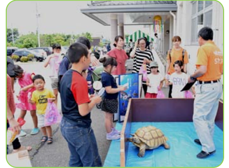
▲陸ガメとあそぼう