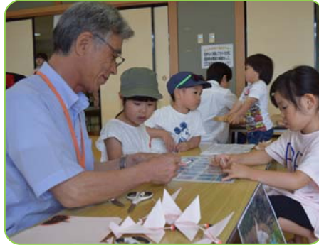
▲トキの折り紙教室