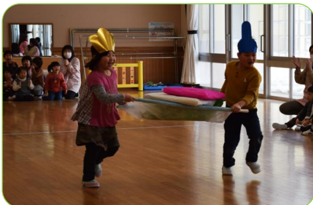
▲おおこうづ保育園

また、子育ての駅てらどまり「にこにこ」では、紙芝居を観たり、保護者が子どもにお内裏様とお雛様の衣装を着せて写真撮影をして、楽しく過ごしていました。