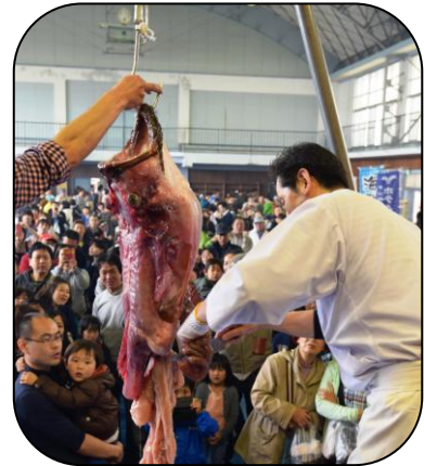
▲アンコウの吊るし切り実演イメージ