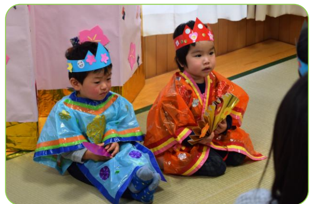
▲子育ての駅てらどまり「にこにこ」