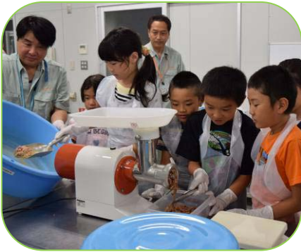
▲トキのえさ作り体験

来年度は、隣接する「長岡市トキと自然の学習館」において、初めての取り組みで「子ども解説員」として来館者をおもてなしする予定です。