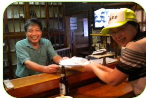
▲飲酒運転防止啓発活動で店舗を巡回