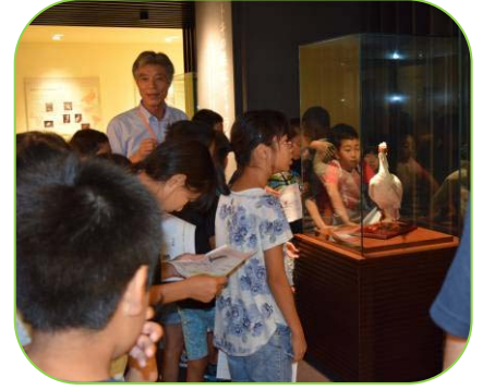
▲トキについて学習