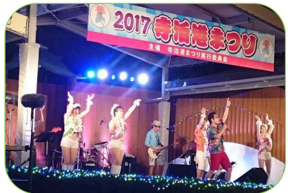
▲桑田研究会バンド