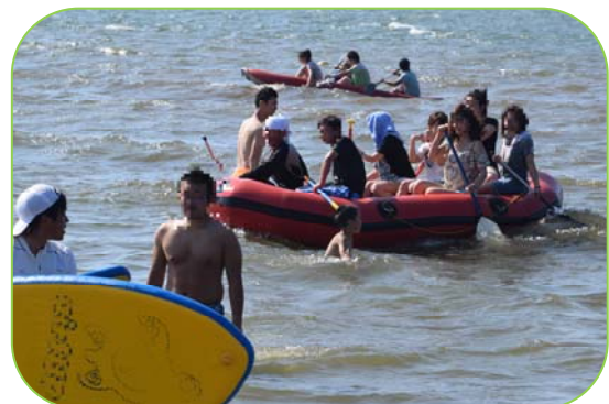
▲ボートで男女楽しく交流