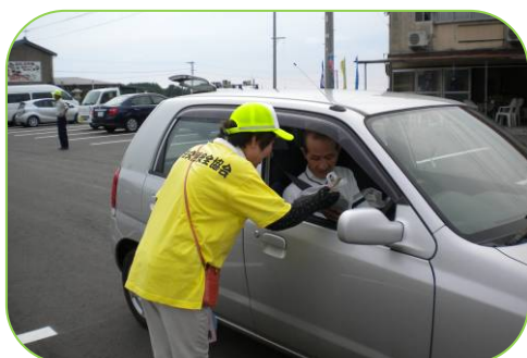
▲交通安全指導所での声かけ

また、夜は飲食店・宿泊施設33店舗を巡回し、飲酒運転防止啓発活動を実施しました。