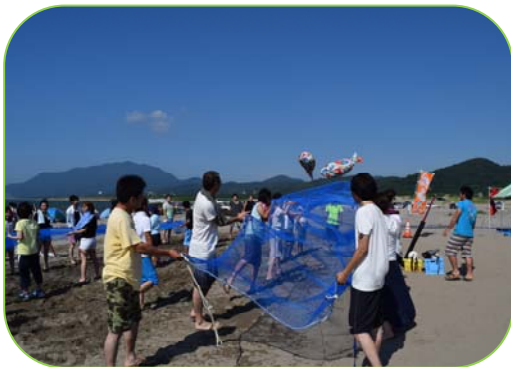
▲寺泊の伝統ゲーム「浜大漁」