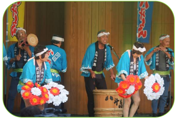
▲群馬県伊勢崎市の八木節