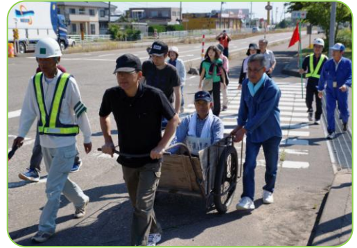
▲指定避難所への避難・誘導訓練！

その後、消防署職員による応急救護訓練が実施され、AEDの操作や心肺蘇生を体験しました。