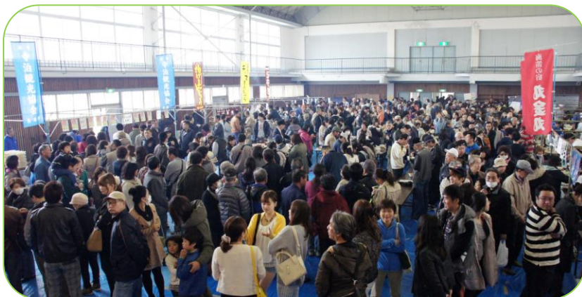
▲会場には、多勢の来場者が詰めかけました！

3月29日(日)、寺泊体育館で「寺泊食の陣」が開催されました。 各屋台には順番待ちの長い列ができ、来場者はようやく味わえた逸品に舌鼓を打って、一日限りの屋台村を満喫していました。