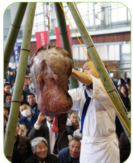
▲「あんこう吊るし切り」の実演