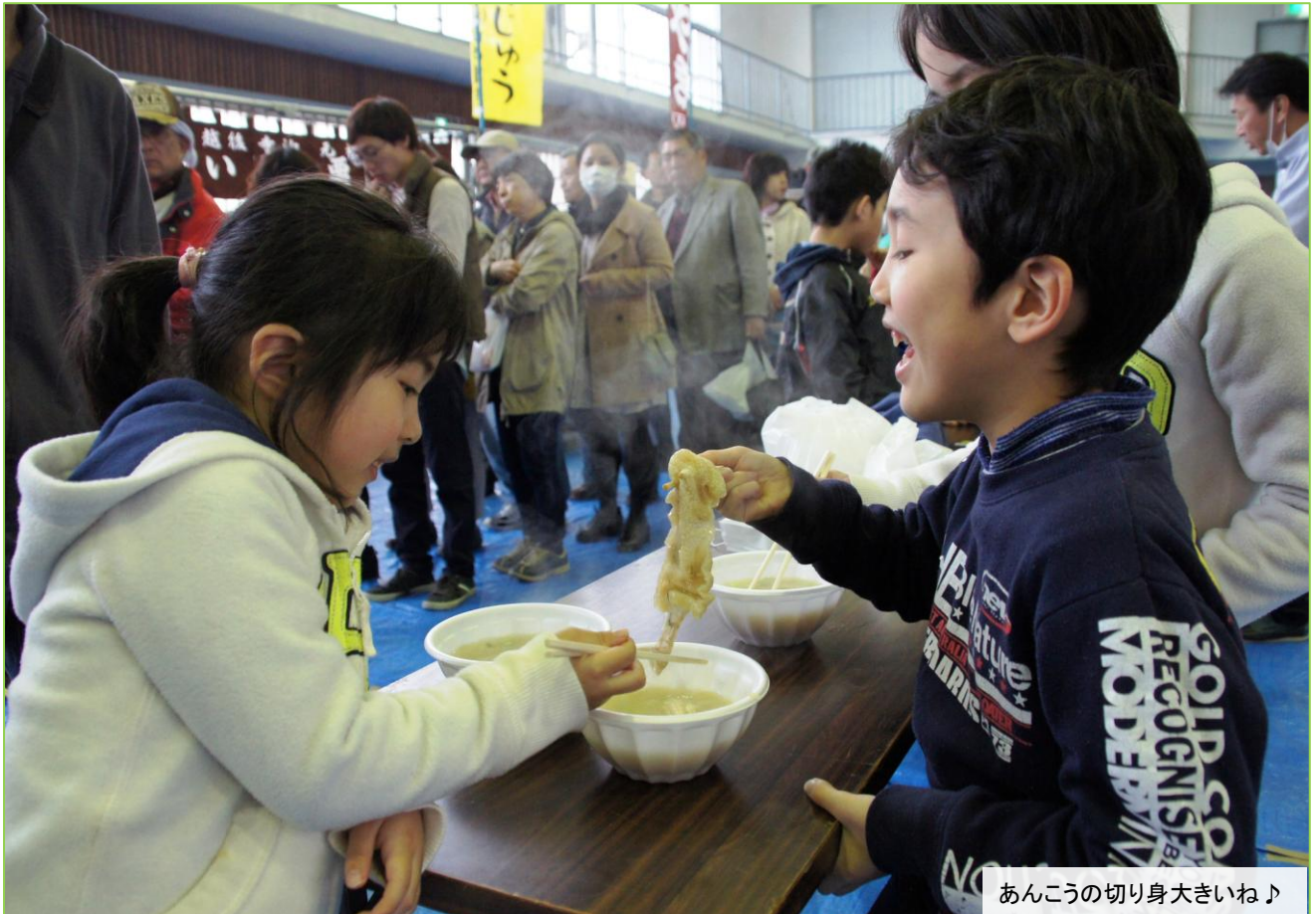
あんこうの切り身大きいね♪

3月29日(日)、寺泊体育館で「寺泊食の陣」が開催されました。 各屋台には順番待ちの長い列ができ、来場者はようやく味わえた逸品に舌鼓を打って、一日限りの屋台村を満喫していました。