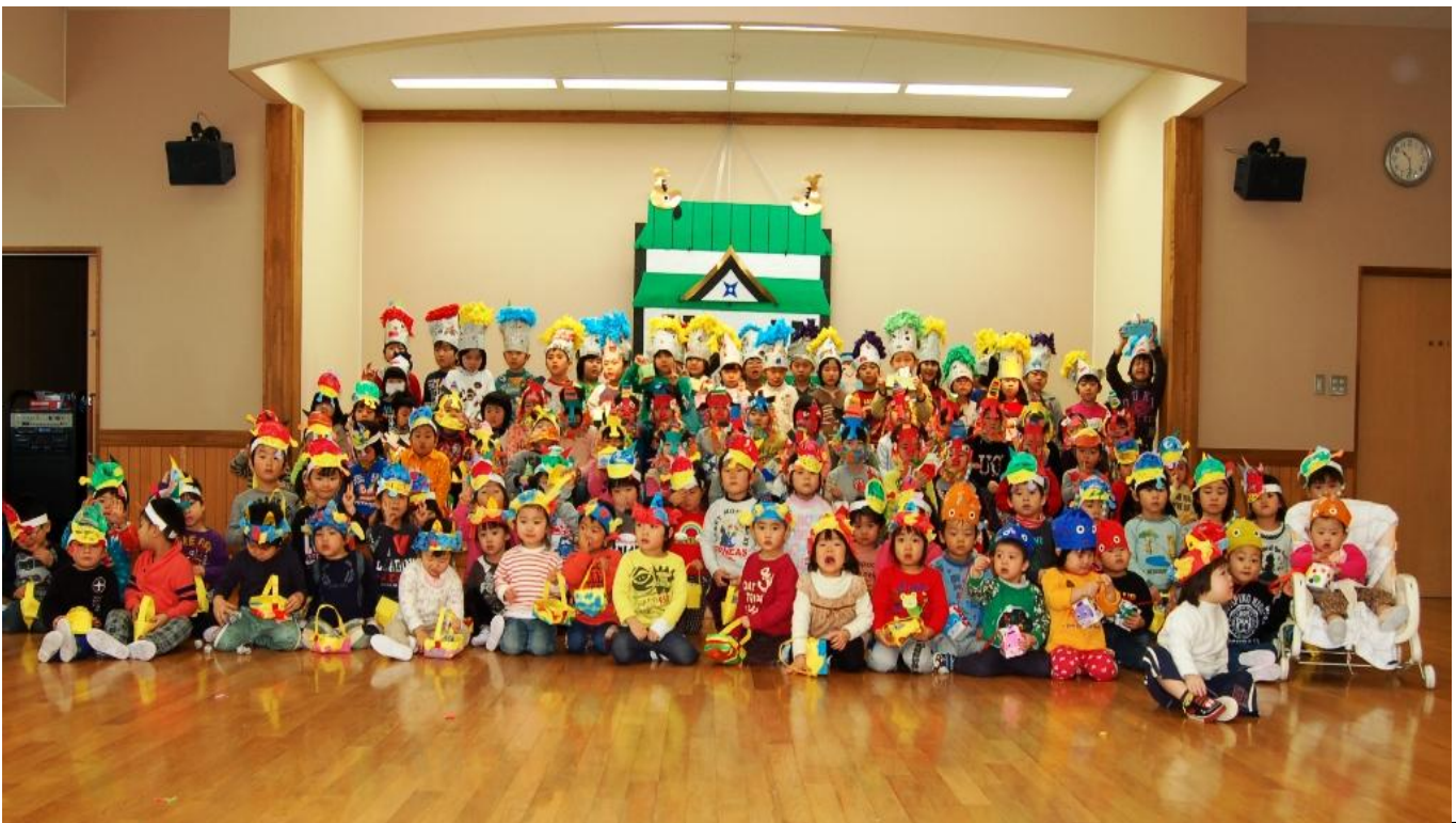
鬼をやっつけて、みんなそろって記念撮影