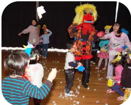
鬼は外！ 悪い鬼はでていけ