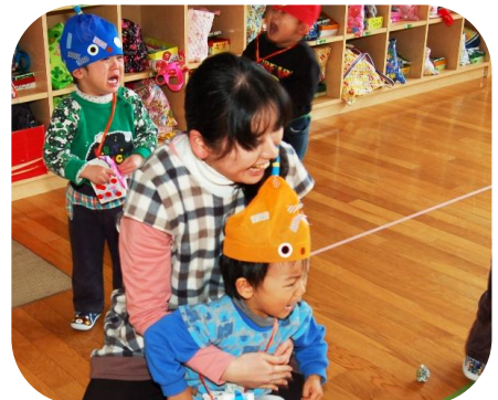
大丈夫だよ こわくないよ