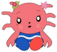
(寺泊イメージキャラクター) 海の妖精神 -まりん-