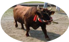
山古志地域の「新宅」号