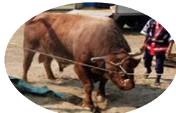
南相馬市の「浜街道」号