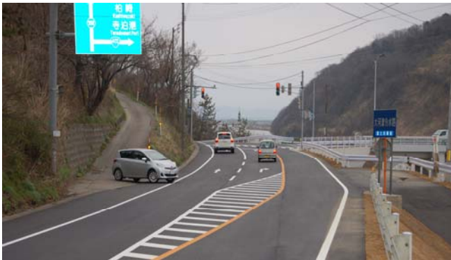
スムーズな通行が可能になった 野積橋北詰交差点

交通渋滞の緩和とともに、観光・物流の基幹道路が整備され、海水浴シーズンの交通渋滞の緩和に大きく貢献するものと期待されます。