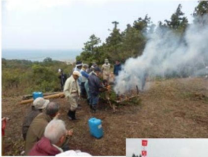
赤坂山城跡 (上田町町内会)

10月16日、中越地震、中越沖地震からの復興を祈念した「にいがた狼煙プロジェクト」が行われました。今年は東日本大震災からの復興の願いも込められ、寺泊地域内では、赤坂山城、夏戸城、野積城のそれぞれの城跡やその周辺から戦国時代を思い起こさせるような白い煙があがりました。当日は風が強い日でしたが、参加者全員が力を合わせて、狼煙上げを成功させることができました。