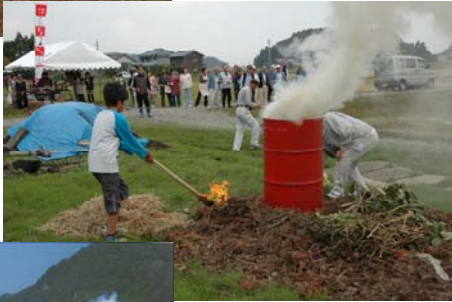
夏戸城ふもと (夏戸集落)