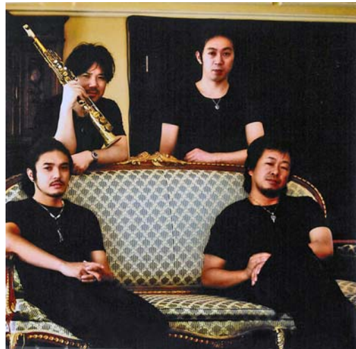
↑ j a j a