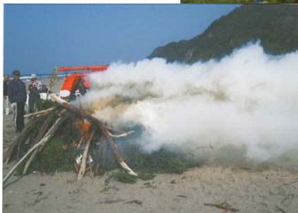
野積海岸 (野積地区)