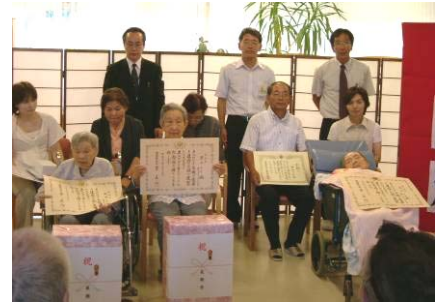
↑ 特別養護老人ホーム桐原の郷にて