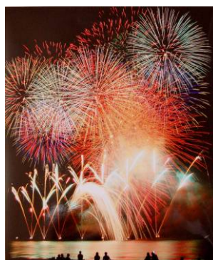
←最優秀賞「海中ワイドスターマイン」