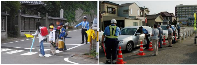
↑朝の街頭指導 (9月21日～30日)