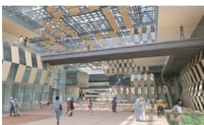
屋根付き広場のイメージ

平成 23 年秋、長岡駅前にアリーナ、屋根付き広場(ナカドマ)、市役所が一体となった全国初の多目的施設が完成予定。施設を紹介するパネル展示を行いますのでぜひご覧ください。