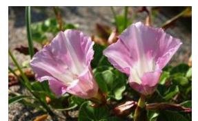
▲ハマヒルガオも 見頃です