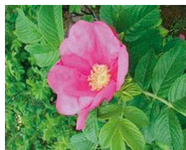
寺泊地域の花(ハマナス)