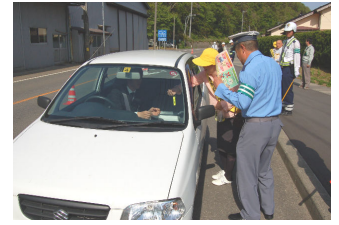
5/14 交通指導所 (二ノ関)