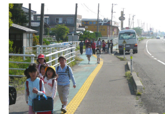
5/11～18 街頭指導 (上)大町、(下)求草