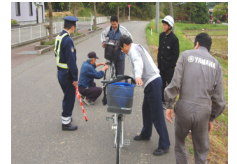
5/15 自転車点検 (吉)