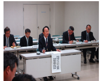
地域委員会での審査