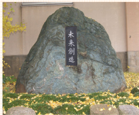
10周年記念碑 「未来創造」

昭和24年 県立与板高校寺泊分校(定時制)として開校。 昭和46年 全日制に移行 昭和55年 現在の場所に、新校舎が完成。 昭和61年 県立寺泊高校(普通高校)として開校。 平成8年 県立寺泊高校10周年記念式典