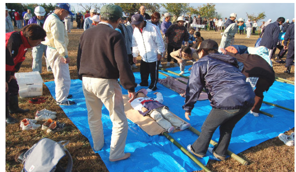
救護訓練（毛布、服を使っての簡易担架づくり）