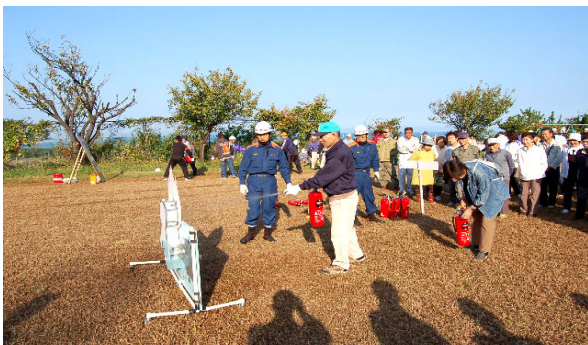
消火器による初期消火訓練