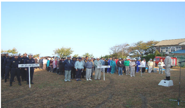
避難訓練（避難場所へ避難完了。旧野積小）

10月22日（日）朝7時過ぎから、野積の中浜・内川・高屋の3集落を対象に、津波の発生を想定した防災訓練が、旧野積小学校を会場に実施されました。訓練には、地域住民の皆さん、消防署員、地元消防団など220名が参加しました。緊急時の避難場所の確認や地震に伴う火災を想定した初期消火訓練、ケガ人などを搬送するための救護訓練を行い、防災への意識を高めました。