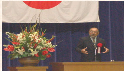
記念講演「寺高の人材育成とは」