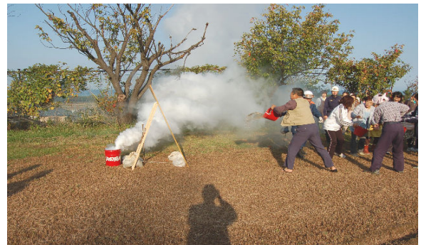
「バケツリレー」による初期消火訓練