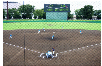
あらなみファイターズVS三柱ファイターズ(伊勢崎)