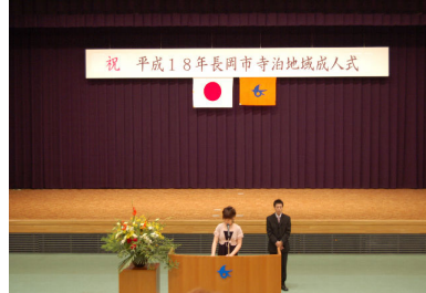
新成人代表あいさつ