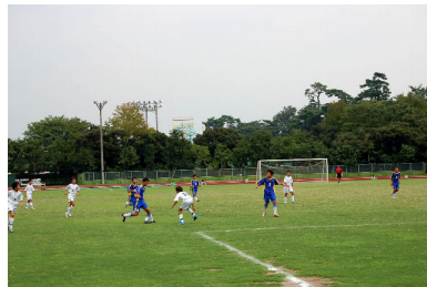
寺泊少年サッカークラブVS伊勢崎市サッカー選抜