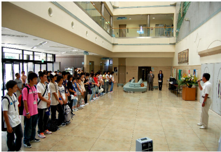
出発式(文化センター)

たくさんの事を学び、感じる事ができた6日間でした。参加した生徒全員、無事で元気に帰ってきました。