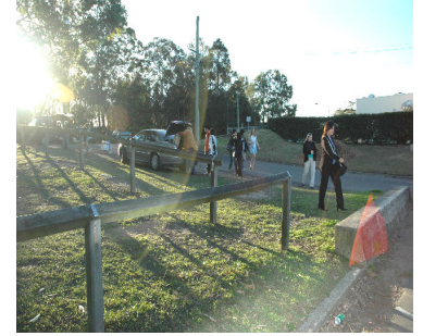
ホストファミリーと対面、各家庭へ