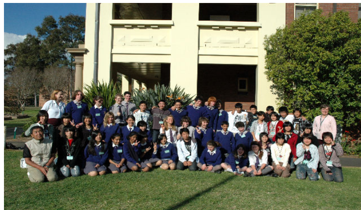
ハールストン農業高校生と記念撮影