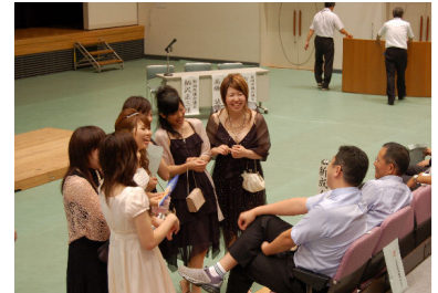
中学校恩師との再会