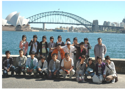
シドニー市内視察