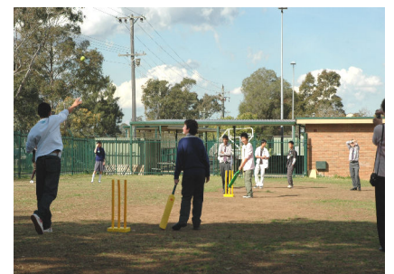
スポーツ交流、「クリケット」に挑戦