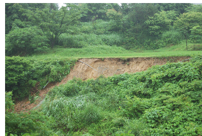
崩れた斜面 (円上寺地内)