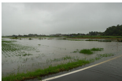
冠水した農地 (町軽井地内)