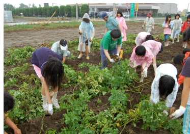
ジャガイモ堀り体験