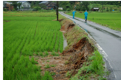
崩れた路肩 (矢田地内)