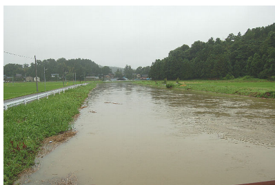
増水した新島崎川