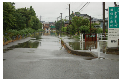
冠水した道路 (敦ヶ曽根地内)