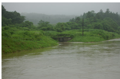
円上寺隧道入口付近