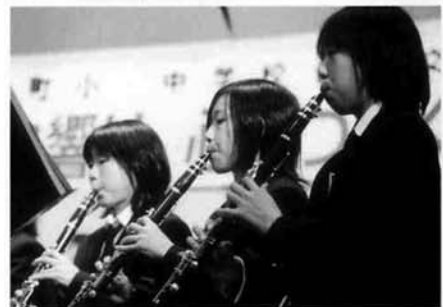
・中学校音楽交歓会 け、心をつなぐハーモ。