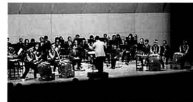
伊勢崎市民吹奏楽団と寺泊太鼓の演奏

11月16日、文化センター「はまなす」において、音楽や郷土芸能、舞踊等の日頃の練習の成果を発表する町民芸能祭が開催されました。伊勢崎市民吹奏楽団や寺泊高校のソーラン踊り、大河津小学校の太鼓クラブなど多彩なステージが展開されました。