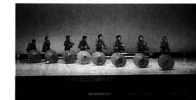
友洋会のみなさん