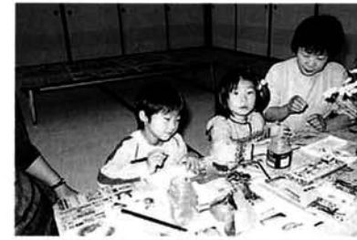
センターおおこうづでの絵手紙体験教室