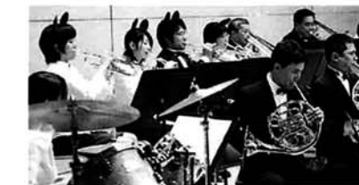
町民吹奏楽団：はまなすウインドアンサンブル