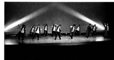
寺泊高校「ソーラン踊り」