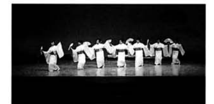
弘泉会のみなさん