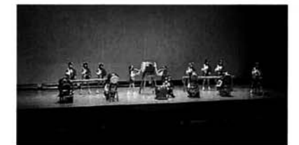
大河津小学校の若竹太鼓